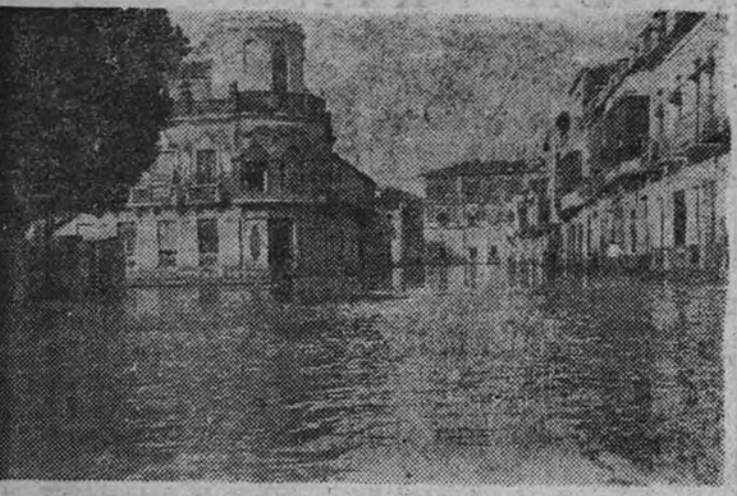
La calle de José Antonio, de Orihuela, cubierta por las aguas del Segura

En Murcia, el Segura ha decrecido dos metros en el día de ayer