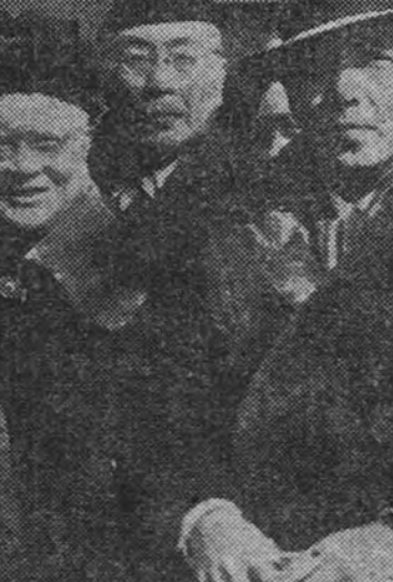
Algunos de los miembros de la Delegación de paz que el Gobierno chino ha enviado a Peiping para confabular con los comunistas, momentos antes de tomar el avión que desde Shanghai les condujo a aquella ciudad

De prevaler la propuesta, las fuerzas armadas norteamericanas tendrían se elevarían, incluyendo Ejército regular y reservas, hasta los 2.589.300 hombres.