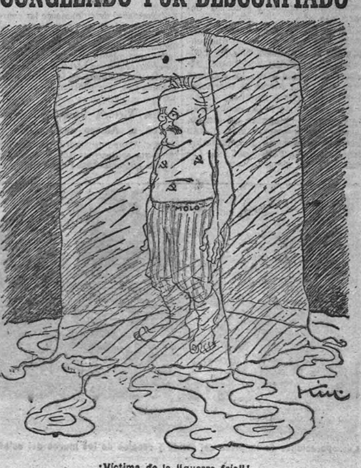
¡Víctima de la "guerra fría"!