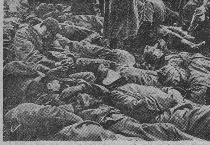
Prisioneros alemanes, al finalizar las operaciones, en un campo de concentración de la U. R. S. S. Más de dos millones de soldados fueron internados en las enormes llanuras y los profundos bosques rusos; ahora, la Unión Soviética sólo da noticias de unos pocos miles de hombres. El resto, esclavos sin nombre ni esperanza, quiere hacerse desaparecer en vida.

MISTERIO ABSOLUTO EN TORNO A LA SUERTE DE DOS MILLONES DE ALEMANES. Sólo existen datos sobre tres mil