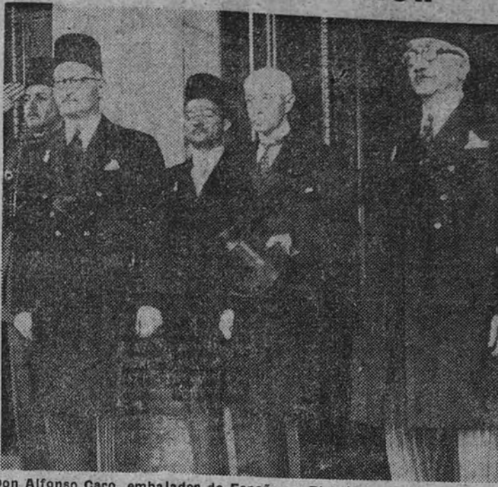
Don Alfonso Caro, embajador de España en El Cairo, momentos después de la presentación de cartas credenciales ante el Rey Faruk de Egipto.