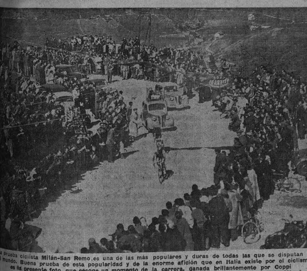
La prueba ciclista Milán-San Remo es una de las más populares y duras de todas las que se disputan en el mundo. Buena prueba de esta popularidad es la enorme afluencia que en Italia existe por el ciclismo, es la presente foto, que recoge un momento de la carrera, ganada brillantemente por Coppi.