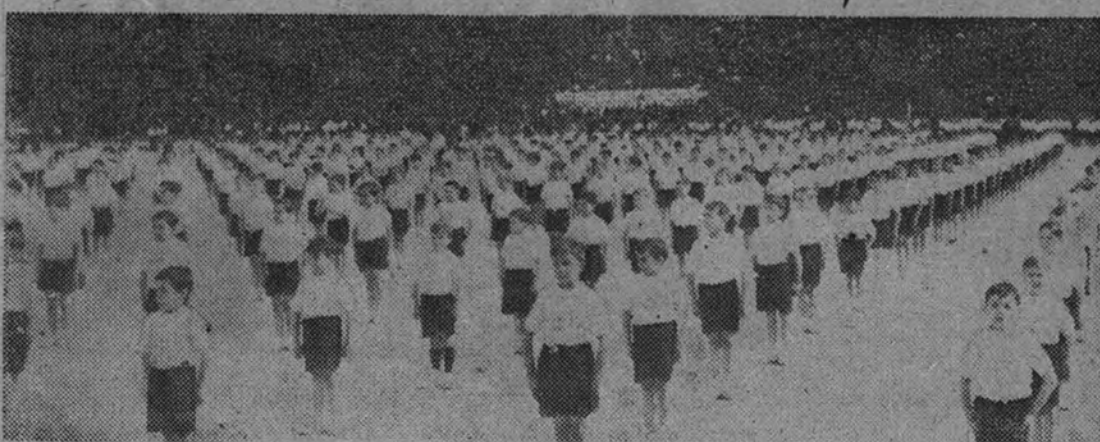
El Frente de Juventudes realiza una labor deportiva como hasta la fecha nadie había llevado a la práctica en España. Desde muy pequeños acostumbra a sus millones de afiliados a practicar los más variados deportes, entre los que, como es natural, no faltan la gimnasia y el atletismo, básicos para la formación física de nuestra juventud.

Seiscientos quince Campeonatos organizó en doce meses el Frente de Juventudes