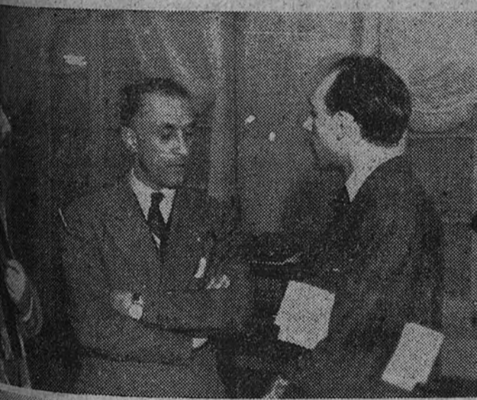
El seleccionador nacional italiano, Copérnico, habla con García Serrano sobre las posibilidades de su equipo.