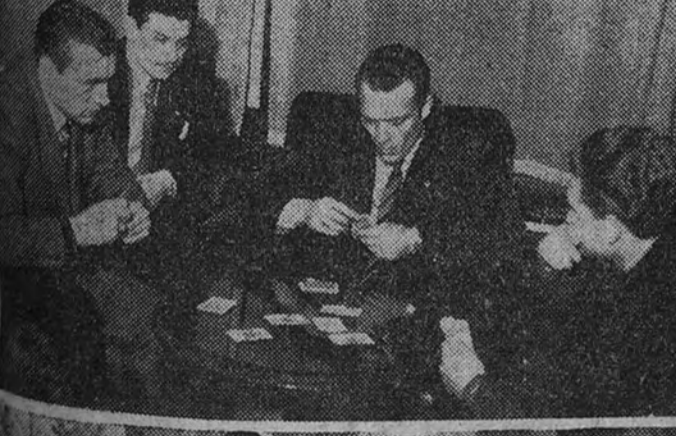
Algunos seleccionados se entretienen jugando a la baraja.—La "Squadra Azzurra" repone fuerzas en el comedor del hotel Felipe II en El Escorial.