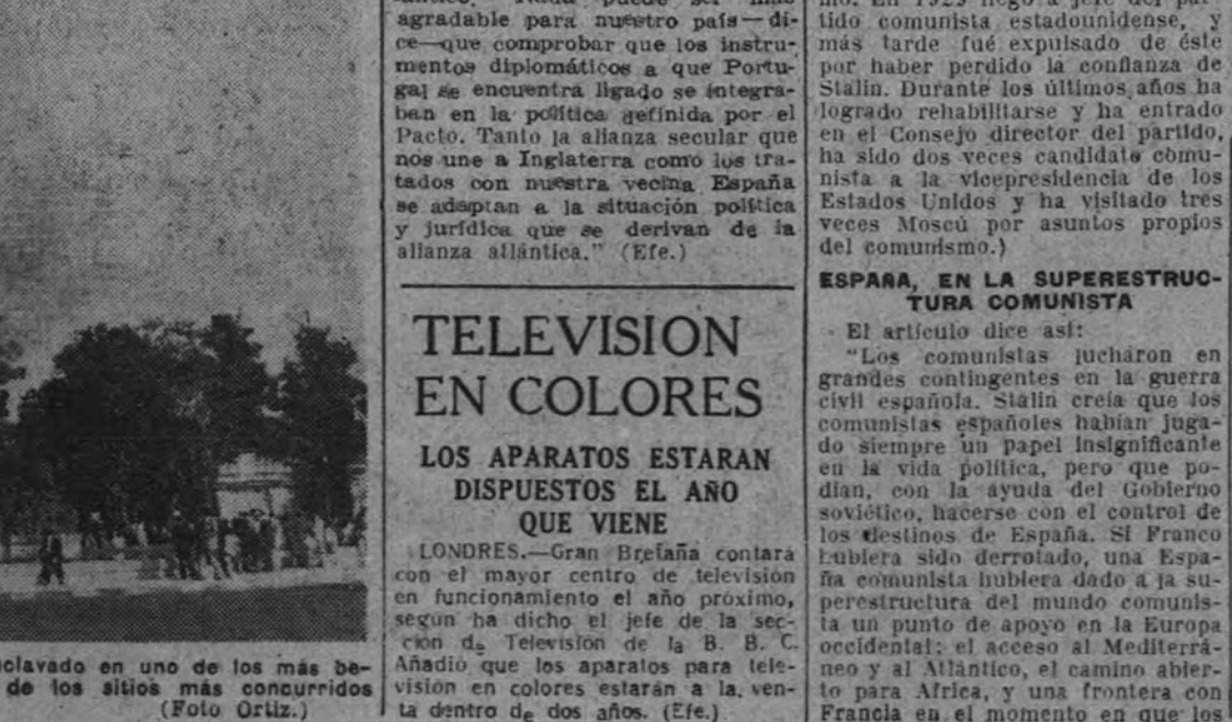
Los españoles cuentan con un magnífico monumento en Buenos Aires. Enclavado en uno de los más bellos lugares de la capital del Plata, se ha llegado a convertir en uno de los sitios más concurridos por los turistas dominicales.