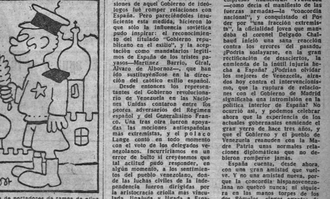
—Pertenezco a la tercera compañía de portadores de ramos de olivo. —Pues yo soy del quinto regimiento de los de la mano tendida... (De "Ce Mastin")