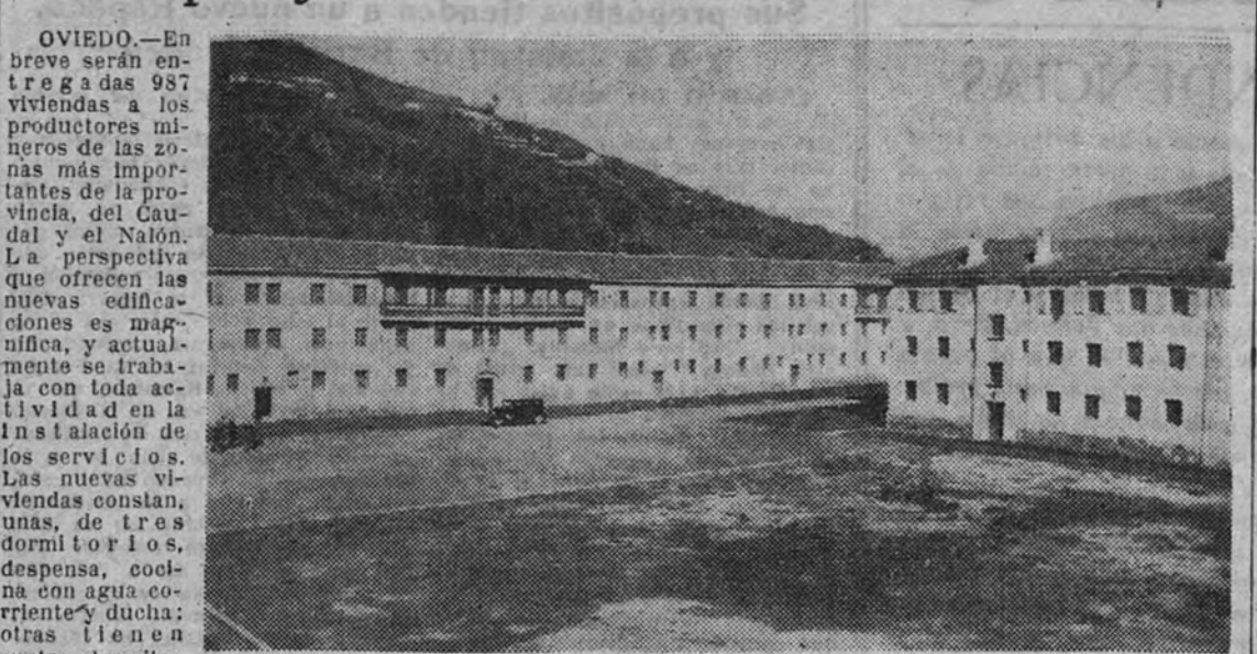
He aquí un aspecto de algunas de las viviendas del grupo de 256 que ya están terminadas en Mieres y en breve serán habitadas por productores mineros de la región.

OVIEDO. — En breve serán entregadas 256 viviendas a los productores mineros de las zonas más importantes de la provincia, del Caudal y el Nalón. La perspectiva que ofrecen las nuevas edificaciones es magnífica, y actualmente se trabaja con toda actividad en la instalación de los servicios. Las nuevas viviendas constan, unas, de tres dormitorios, despensa, cocina con agua corriente, duchas y otras tienen cuatro dormitorios. El alquiler de las primeras de 45 pesetas, y el de las segundas, 60, y así, en una escala ascendente, hasta 180 pesetas las de doce dormitorios. El régimen de amortización será de 64,98 pesetas las de tres dormitorios, 86,64 las de cuatro y hasta 259,92 las de doce. En la zona Sur, en Mieres, ya construidas ya 256 viviendas, y en un segundo plan serán levantadas 400 más, en la zona Norte los trabajos están muy adelantados y se construyen 364 viviendas y 16 locales para tiendas; en Fargado están totalmente terminadas 221; en Vega de Soto (Morán), 144; en Pola de Laviana, 64; en Pando (L. Pelguera), 108; en Samuño (Sama), 60, y 164 en la Camocha. En período de construcción hay