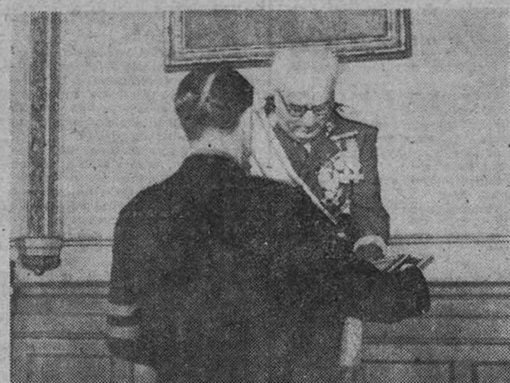
El Delegado Provincial del Frente de Juventudes de Burgos entrega al Capitán General, don Juan Yagüe, un pergamino como homenaje de la Juventud falangista de la provincia al Ejército.

Comenzó el acto con unas palabras del Delegado Provincial, ofreciendo el homenaje como testimonio de cariño y admiración al Ejército, "homenaje a los hombres que nos salvaron de los horrores del chequismo, y que nadie puede recibir mejor que el general que, capitán de los mejores tercios, defendió nuestras banderas por las tierras del sur, del norte de la Península y de África española. Queremos que seáis que la juventud burgalesa admira al Ejército español y admira a quien en este momento le representa y que siempre estará con él cuando de defender la Patria se trate, porque este vigor que las Juventudes obtienen en las filas de las Falanges juveniles de Franco, siempre dispuesto al sacrificio por su Patria."