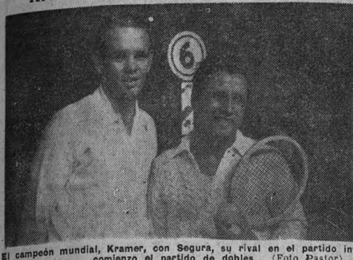
El campeón mundial, Kramer, con Segura, su rival en el partido internacional de dobles.

Los campeones mundiales del tenis profesional jugaron ayer en Recoletos Kramer y Pails vencieron en simples