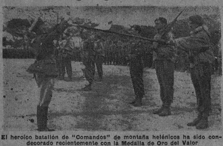
El heroico batallón de "Comandos" de montaña helénica ha sido condecorado recientemente con la Medalla de Oro del Valor.