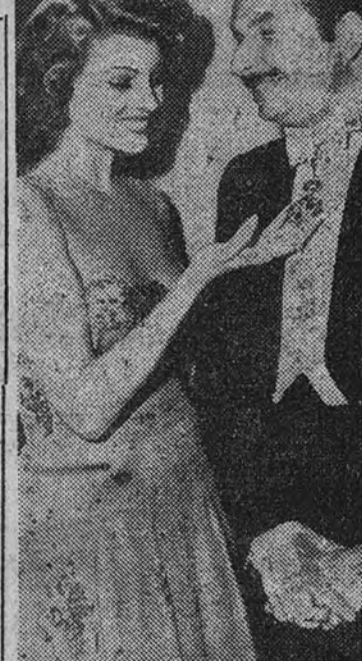
Xavier Cugat, el célebre músico y dibujante español, enseña a la actriz Rita Hayworth una coreografía que le fué otorgada por el Gobierno cubano

La confusión en el Sindicato de Músicos argentinos ha sido grande, y hubo la consiguiente reacción. Se aplaudió a Cugat, quien volverá, de paso para Brasil, dentro de tres se-