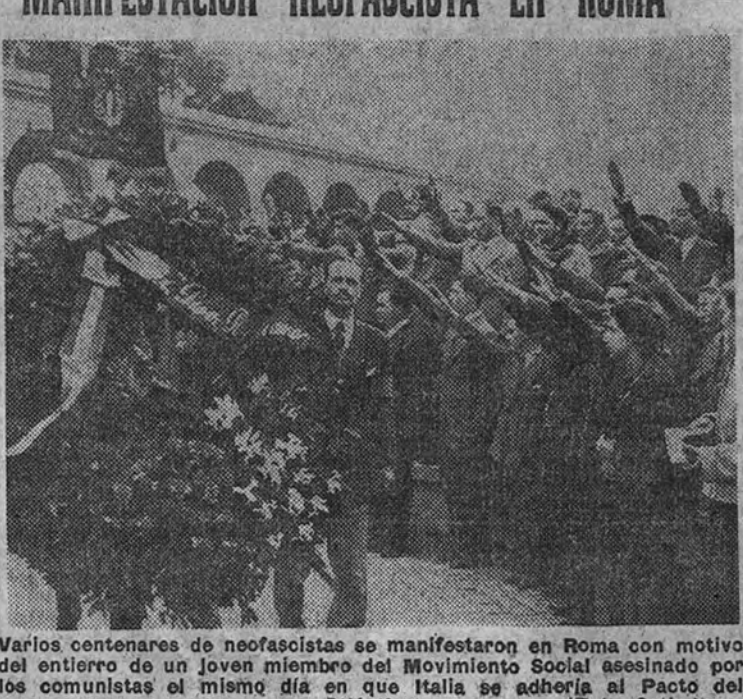
Varios centenares de neofascistas se manifestaron en Roma con motivo del entierro de un joven miembro del Movimiento Social asesinado por los comunistas el mismo día en que Italia se adhirió al Pacto del Atlántico.

Vemos cómo el sombrero cilíndrico de Radio Moscú queda bien patente a la luz de estos dos textos. Si Radio Moscú se arranca en ese tono contra nuestro colaborador, el hecho no se debe a que existan contradicciones entre sus palabras y las del Caudillo, sino a que el artículo de "Juan Español" llegó (porque también aquí tenemos nuestros traductores) a los oídos rusos con argumentos demasiado peligrosos. El pobre "tovarich" encandilado todos los días con la supuesta entrega de los países occidentales al capitalismo norteamericano, oye repetir en su idioma y con palabras irrefutables todo lo que Wall Street ha derramado sobre la Unión Soviética, sin conseguir despegar la sombra del hambre del infeliz paisaje humano de Rusia. Conoce, mientras oye a escondidas una radio extranjera, cuáles son las razones anticomunistas de España, los victoriosos argumentos de su paz y el fracaso del gran "complot" soviético contra este Régimen y contra este pueblo.