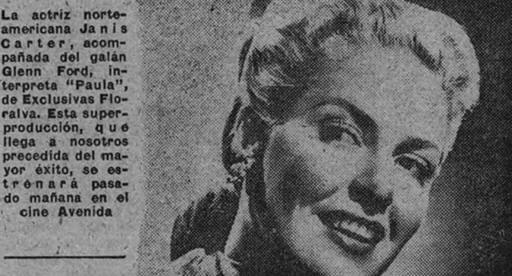
ANTE UN ACONTECIMIENTO SIN PRECEDENTES

La presentación en España de la gran versión cinematográfica de "Fabiola" según la novela del cardenal Wiseman se ha fijado para la fecha del Sábado de Gloria, en el Palacio de la Música, "Fabiola", de Alessandro Blasetti—el genial animador italiano—, para la editora Universal, distribuida por Filmofo, S. A., es un espectáculo verdaderamente gigantesco. "Fabiola" agota todos los recursos de una época del cine, y demuestra que Europa puede ser,