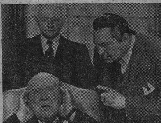
COMO SE FILMO "HOMBRES DE PRESA"

BURT LANCASTER EN "AL VOLVER A LA VIDA" Perseguido, encarcelado y abandonado por su mejor amigo, el protagonista de "Al volver a la vida", la grandiosa superproducción de Paramount que distribuye Mercurio Films, y que será el estreno sensacional del próximo Sábado de Gloria en el aristocrático cine del Callao, realiza la venganza más dramática e