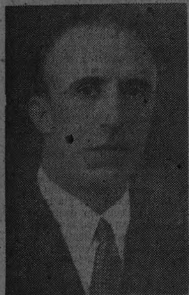
Federico Mayo Gayerre, director general del Instituto Nacional de la Vivienda y Jefe Nacional de la Obra Sindical del Hogar

Interesantísimas declaraciones del ilustrísimo señor don Federico Mayo Gayerre, director general del Instituto Nacional de la Vivienda