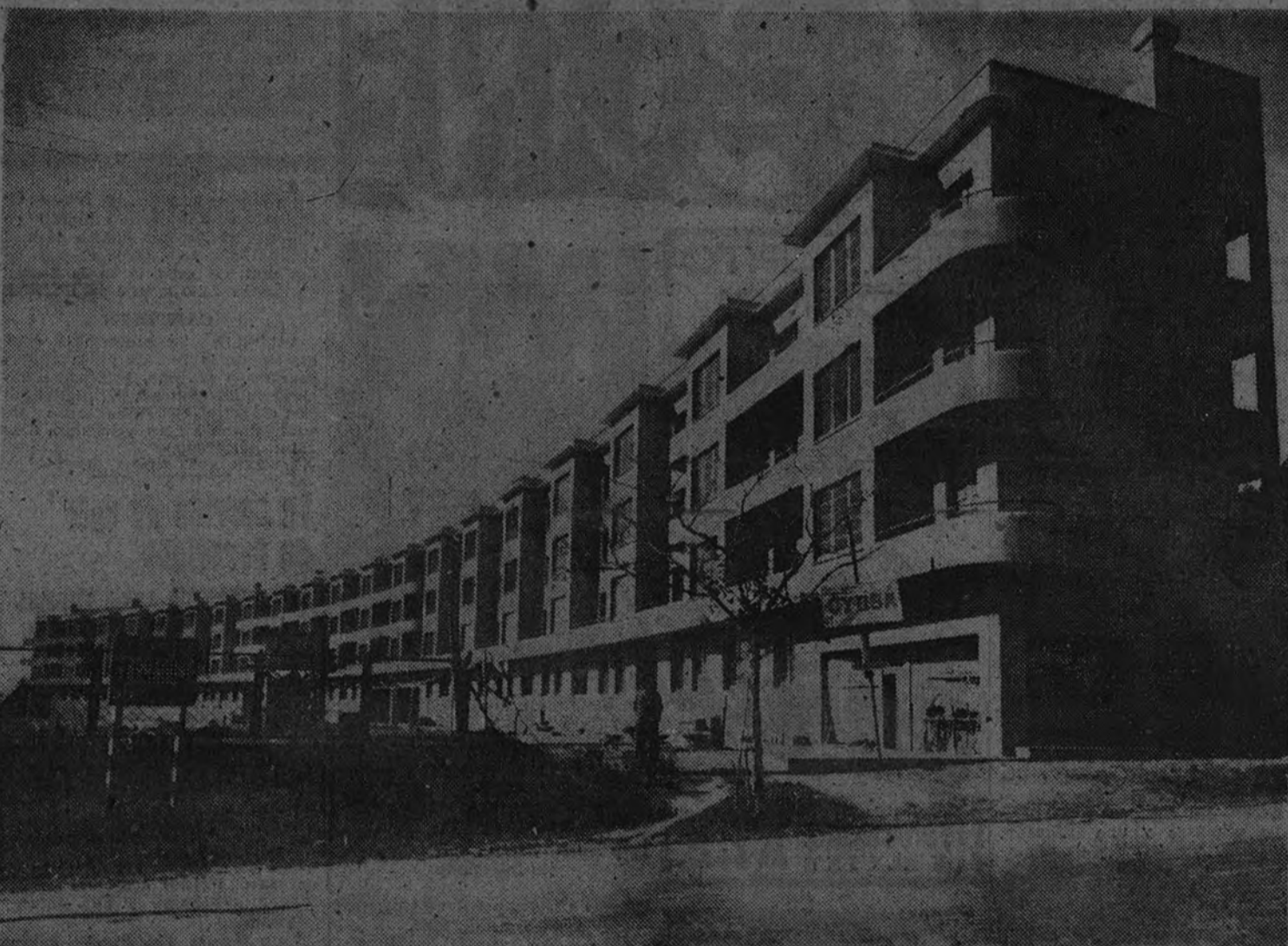
Grupo "Alegria y Descanso" (Tarragona)

Es justo resaltar aquí la constante colaboración que en la realización de estos proyectos ha prestado siempre a la Obra Sindical del Hogar el Gobernador Civil y Jefe Provincial del Movimiento, camarada Carlos Ruiz.