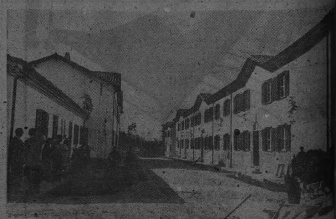
Grupo "Guillermo Lafuente" (Oviedo)