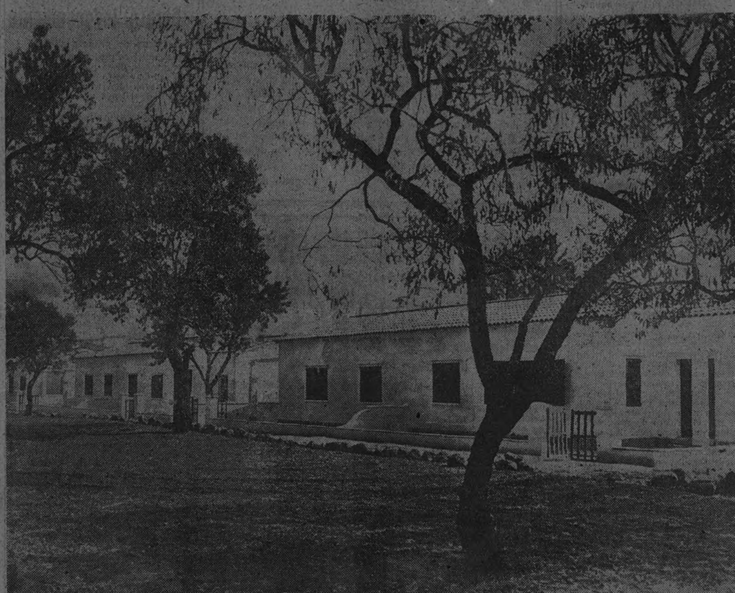
Grupo "José Antonio" (Inca, Baleares)

—En efecto; el Instituto, siguiendo las directrices del ex-