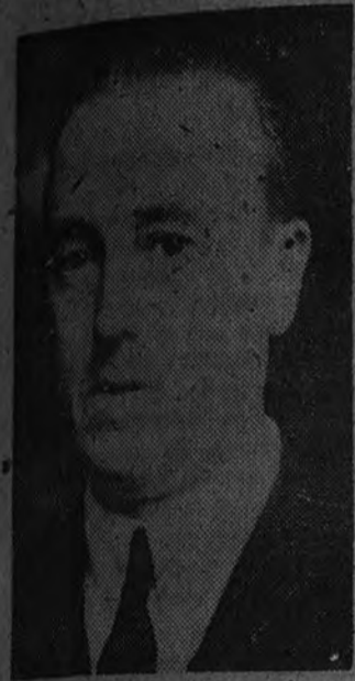
Fermín Sanz Orrio, Delegado Nacional de Sindicatos

El Delegado Nacional de Sindicatos, camarada Fermín Sanz Orrio, expone la actuación de la Obra Sindical del Hogar