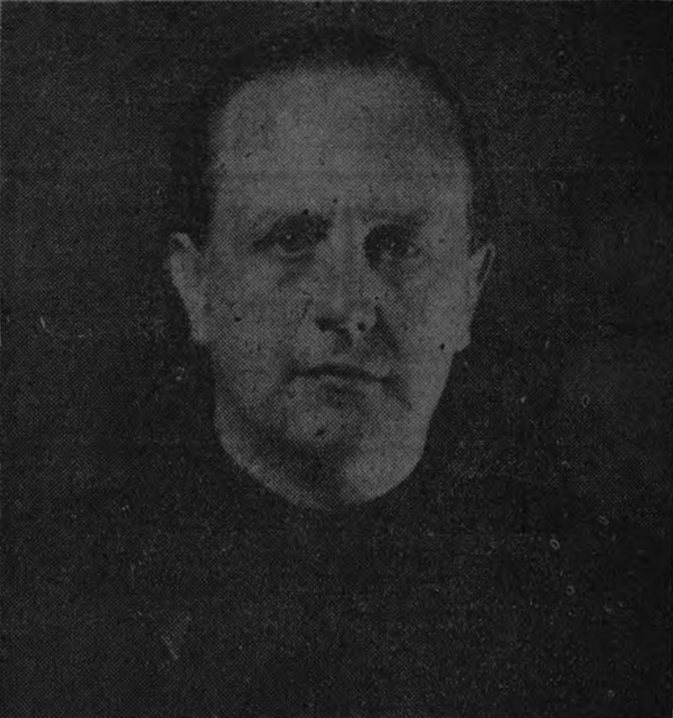
El Secretario General del Movimiento, camarada Raimundo Fernández Cuesta, para quien el problema de la vivienda humilde constituye una preocupación constante

Con natural satisfacción ofrecemos el ejemplo de numerosas Empresas que han prestado su colaboración. Así: Boeticher y Nava-