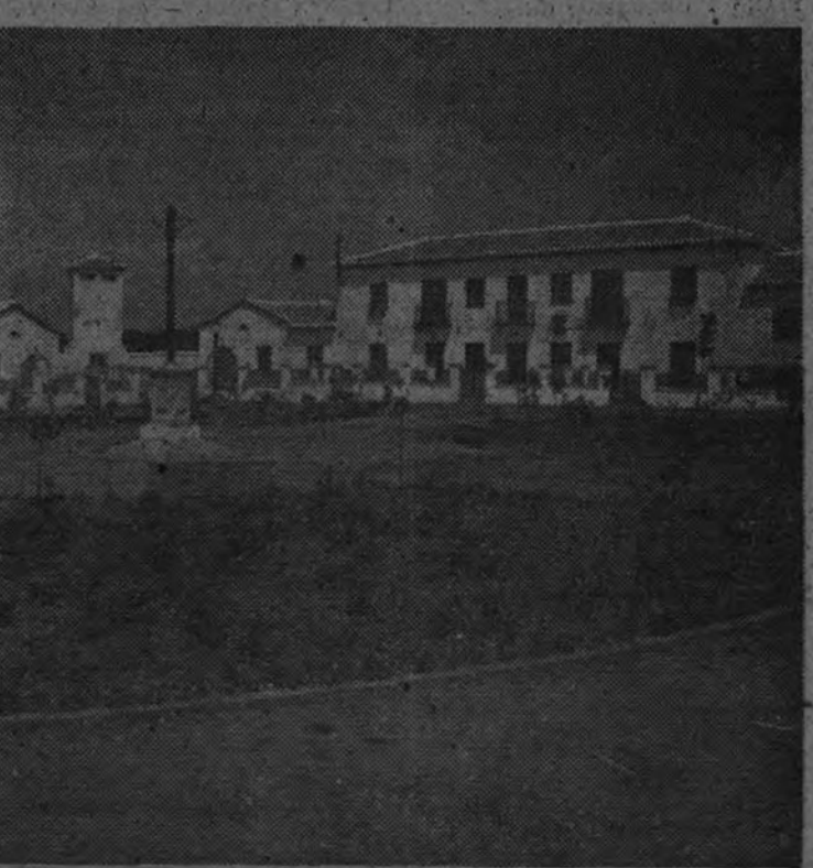
Grupo "Nuestra Señora de la Merced" (Sevilla)

—Deseamos todos que estas palabras finales con las que el Delegado Nacional de Sindicatos cierra sus interesantes declaraciones encuentren pronta confirmación, porque así podremos ver resuelto en breve uno de los problemas más graves que hoy gravitan sobre la vida de nuestro pueblo.