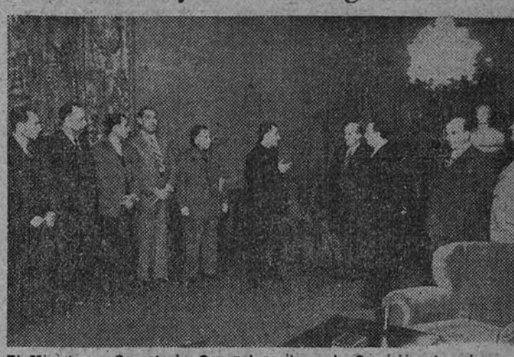
El Ministro y Secretario General recibe a la Comisión de mineros de Puertollano.

Los productores reiteraron su adhesión al Caudillo y a la Falange