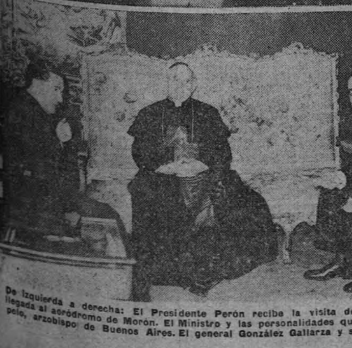
De izquierda a derecha: El Presidente Perón recibe la visita del general González Gallarza, acompañado del embajador de España, conde de Motrico. Momento de la llegada al aeródromo de Morón. El ministro y las personalidades que acompañaron al general Gallarza, cumplimentan a doña María Eva Duarte de Perón en su despacho de la Secretaría de Trabajo.

NANKIN.—Oficialmente se anuncia que las bajas en los buques de guerra británicos “Amethyst” y “Consort”, atacados por la artillería comunista en el Yangtse son 26 muertos y 23 heridos. El “Consort” ha fondeado en Shanghai y lleva nueve muertos y tres heridos a bordo. Dos de sus cañones fueron inutilizados y ha sufrido otros daños en su estructura por el ataque comunista. Cincuenta y nueve marineros y cuatro marinos chinos del “Amethyst” han llegado por ferrocarril a Shanghai. Se salvaron llegando a bordo a la orilla derecha del Yangtse y recorriendo después 10 kilómetros hasta alcanzar la vía férrea.