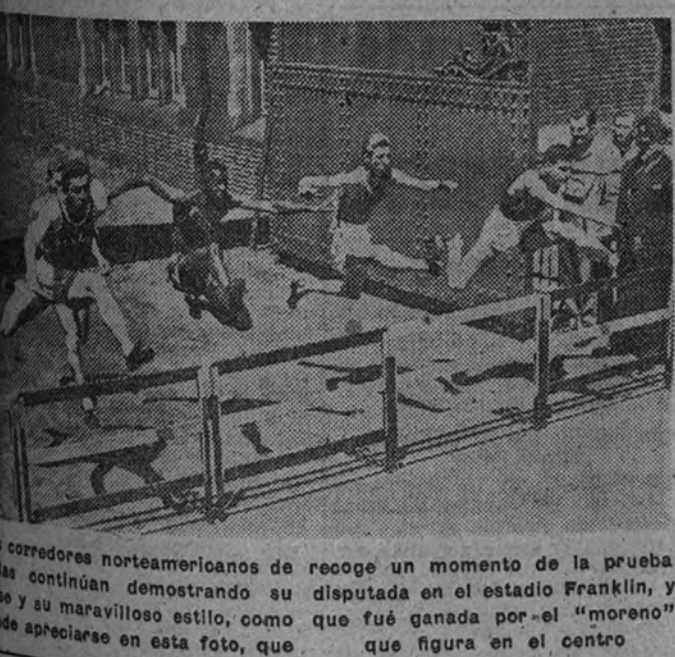
Los corredores norteamericanos de vallas continúan demostrando su clase y su maravilloso estilo, como puede apreciarse en esta foto, que recoge un momento de la prueba disputada en el estadio Franklin, y que fué ganada por el "moreno" que figura en el centro

Si aquello no se hizo, parece que ahora va en serio la construcción de cuatro terrenos deportivos de barriada y de una piscina en la Casa de Campo, próxima al lago. No seremos de los que consumamos el emplazamiento de la nueva piscina, porque puede existir el riesgo de quedarnos sin ninguna. Hagase donde sea, cualquier día se comprenderá la necesidad de emplazarla en zonas más céntricas, para que el deporte y el empleo puedan en pocos minutos cumplir con la idea de asco y mejoramiento físico. Ideas que no pueden estar solucionadas con tristes establecimientos balnearios en barrios populares. Eso es distinto. Por ahora, lo principal es que se hagan los campos para deportistas modestos y la piscina. Cuando se vea su utilidad surda la ampliación. Lo primero es empezar.