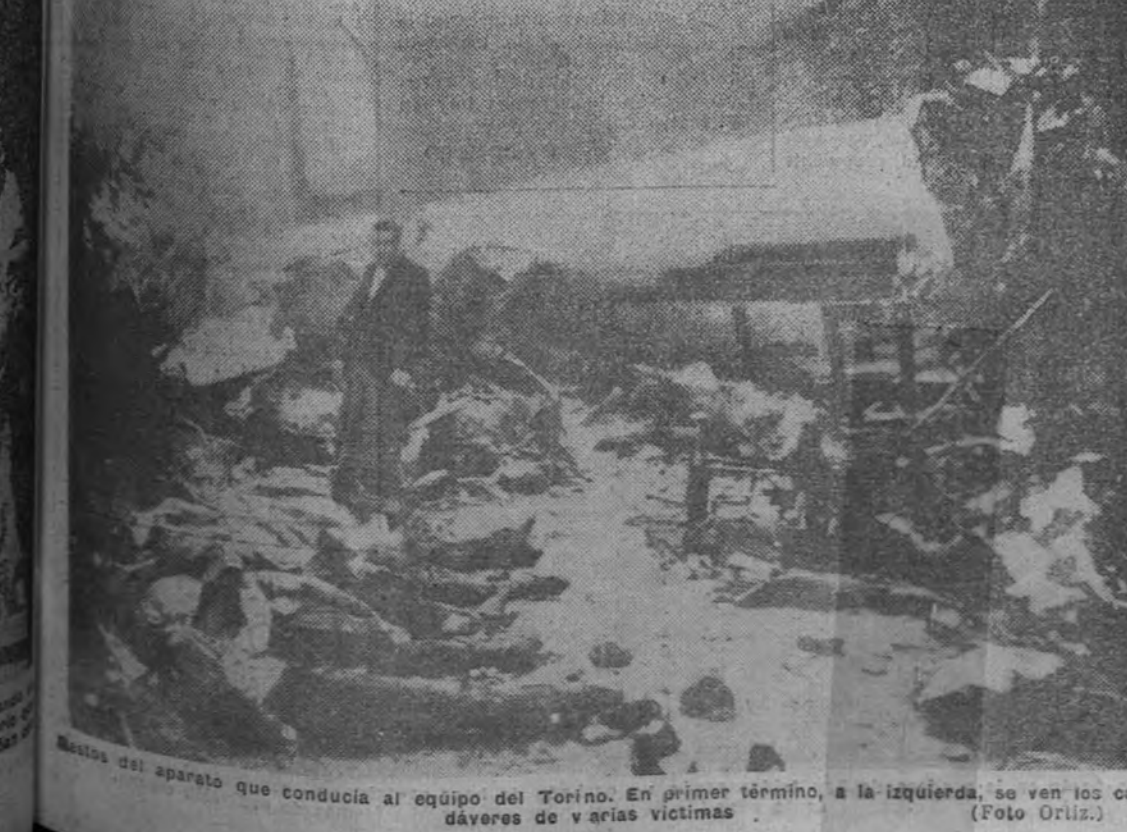
Restos del aparato que conducía al equipo del Torino. En primer término, a la izquierda, se ven los cadáveres de varias víctimas.