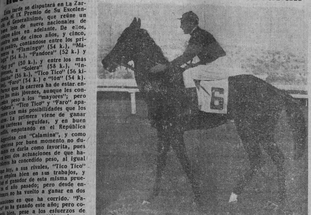
"Solera" es nuestro favorito en el Premio de S. E. el Generalísimo, que esta tarde se corre en La Zarzuela

Esta tarde se disputará en La Zarzuela el IX Premio de Su Excelencia el Generalísimo, que reúne de nuevo a los nueve productos nacionales de más edad en adelante. De ellos, cuatro son de cinco años, y cinco, de seis. Entre los más jóvenes, el "Faro" (54 k.), "Mambrino" (54 k.), "Pandora" (52 k.) y "Soy yo" (50 k.), y entre los más veteranos, el "Solera" (58 k.), "Induch" (56 k.), "Tico Tico" (56 k.), "Faro" (54 k.) y "Pandora" (52 k.).