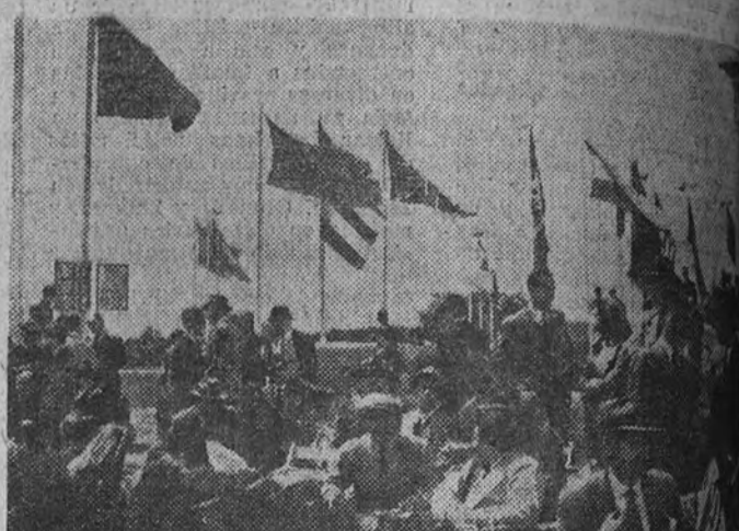
Un aspecto del campo de La Moraleja, donde estos días, con asistencia de aficionados, se está disputando el Campeonato del mundo de tiro de pichón. Al fondo pueden verse las banderas de las naciones que participan en esta prueba.

Ciento treinta tiradores se encuentran dentro de la prueba, y además de los dieciséis sin cero, se hallan treinta y nueve con uno, cincuenta y nueve con dos y sesenta y dos con tres.