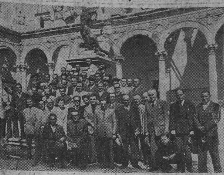
Los asistentes al I Congreso Sindical del Campo de Castilla la Nueva y Albacete durante su visita a las ruinas del Alcázar

TOLEDO.—El pasado domingo ha quedado clausurado el I Congreso Sindical del Campo de Castilla la Nueva y Albacete, que ha venido de- sarrollando sus tareas durante los días 5, 6 y 7.