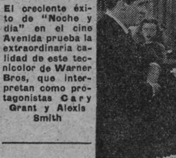
El creciente éxito de "Noche y día" en el cine Avenida prueba la extraordinaria calidad de este technicolor de Warner Bros., que interpretan como protagonistas Cary Grant y Alexis Smith.

La más genial creación de GROUCHO, HARPO y CHICO MARX TOLERADA MENORES