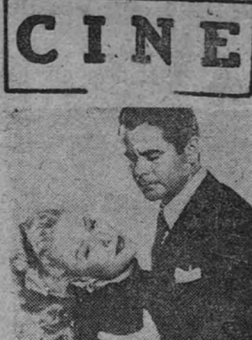
Janis Carter y Glenn Ford, la admirable pareja de "Paula", de Exclusivas Florival. El Real Cinema exhibirá este film desde mañana, lunes.

¿Qué tiene de desayuno? (Solución en el próximo número.) SOLUCION AL ENTRETENIMIENTO ANTERIOR —Representa doce.