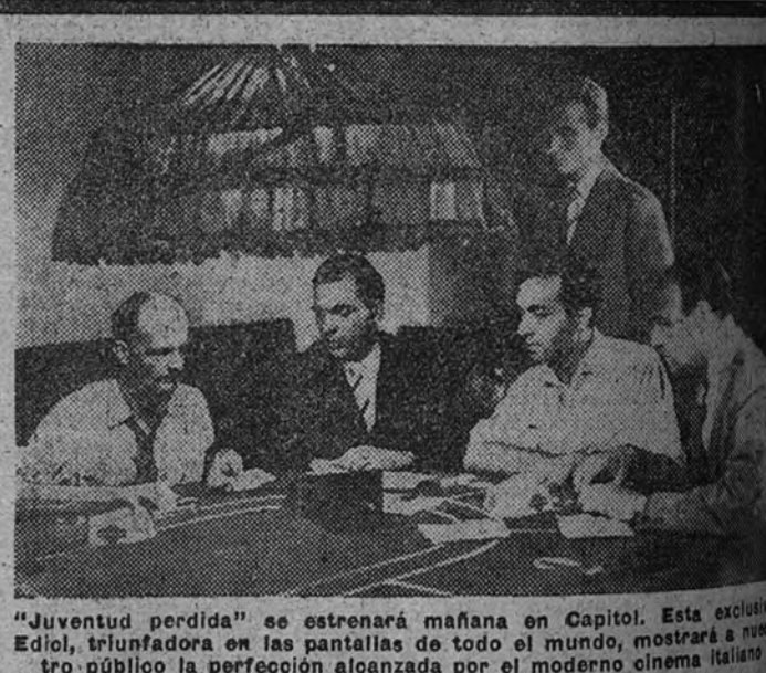
"Juventud perdida" se estrenará mañana en Capitol. Esta exclusiva Edici, triunfadora en las pantallas de todo el mundo, mostrará a nuestro público la perfección alcanzada por el moderno cine italiano.

Como esta extraordinaria película de Warner Bros., "Noche y día", no será reestrenada en la presente temporada, el aficionado madrileño se ha volcado, como vulgarmente se dice, sobre las taquillas del lujoso cine Avenida, llenando, ya en cuarta semana, este salón cinematográfico. "Noche y día" es un torbellino de luz, color, música y belleza, interpretada magistralmente por los zetas del cine Cary Grant y Alexis Smith, con Gynny Simms, Monty Woolley y Jane Wyman y un elenco de las más hermosas muchachas de Hollywood. Al igual que triunfa en todo el mundo, triunfa en Madrid, en la pantalla del elegante Avenida, que una vez más ha ofrecido a los aficionados madrileños otra sensacional y sorprendente obra maestra de la cinematografía moderna. "Noche y día" continuará todavía por mucho tiempo en este salón.