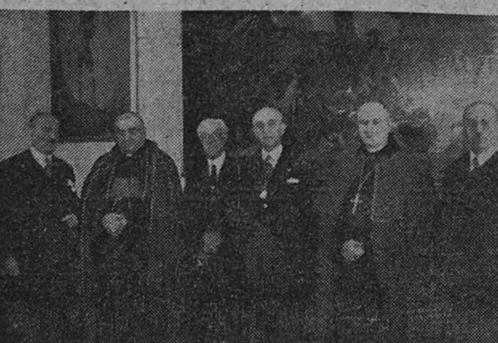
En la Academia de Ciencias se celebró ayer una sesión homenaje al doctor don Manuel Prado, ex Presidente de la República peruana. En la foto, el señor Prado, con las ilustres personalidades que presidieron el acto académico.

Le entregó el diploma de académico corresponsal