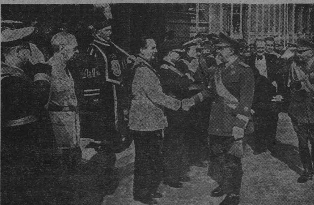
Su Excelencia es recibido por el Gobierno a su llegada al palacio de las Cortes Españolas.

Con motivo de la solemne sesión de apertura de las Cortes Españolas, Madrid organizó una imponente manifestación de homenaje y adhesión a Franco, en la que participaron la casi totalidad de los trabajadores de cada uno de los sectores laborales, de nuestra capital. SALIDA DE PALACIO El Caudillo salió del Palacio Nacional, aproximadamente, a las seis de la tarde, para dirigirse, por Ballén, Mayor, Puerta del Sol y Carrera de San Jerónimo, que se hallaban engarzadas con