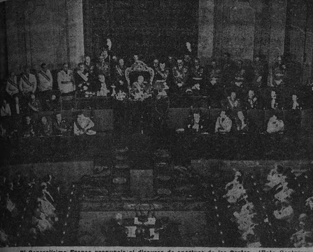
El Generalísimo Franco pronuncia el discurso de apertura de las Cortes.