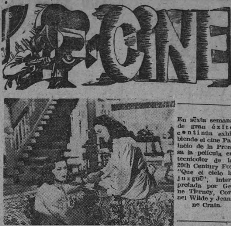
En sexta semana de gran éxito continúa exhibiendo el cine Palacio de la Prensa la película en tecnicolor de la 20th Century Fox "Que el cielo la juzgue", interpretada por Gene Tierney, Cornel Wilde y Jeanne Crain.

Luis Miguel Dominguín toreó muy bien con el capote a sus dos toros, a los que banderilleó superiormente, siendo ovacionado. Con la muleta, al primero le hace una faena por derechos, naturales y de pecho. Mata de una estocada. (Ovación, oreja y vueltas.) En el cuarto mejora la faena de muleta del anterior. Hay pases redondos y naturales en circunferencia, molinetes, de rodillas, faroles y de otras marcas. Entre ovación y música cita a recibir y a dar más de media estocada. Descabello. (Gran ovación, dos orejas, rabo, pata y salida en hombros de la plaza.) (Cifra.)