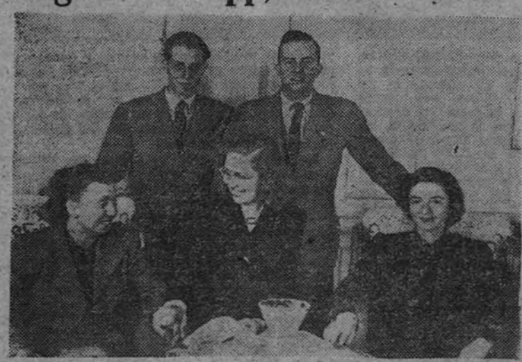
La ilustre escritora y guionista Virginia van Upp ha realizado una emisión desde los estudios de Radio S. E. U. Aquí aparece en compañía de los locutores de la emisora.