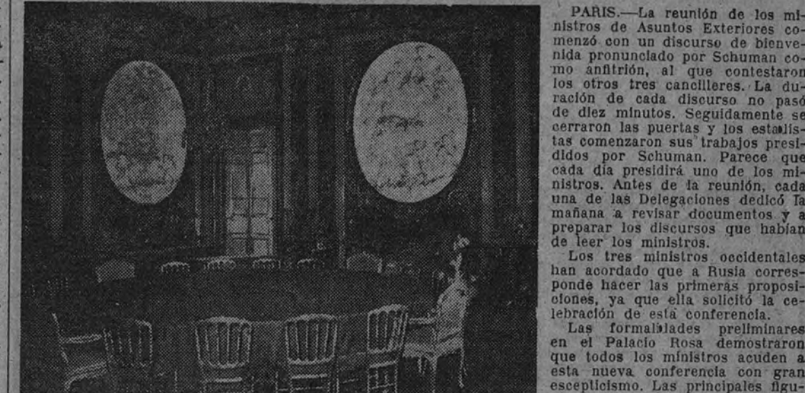
Este es el salón donde desde ayer se están reuniendo los tres ministros de Asuntos Exteriores de Norteamérica, Inglaterra y Francia con el de la Unión Soviética para discutir las posibilidades de llegar a un tratado de paz con Alemania y Austria, entre otras importantes cuestiones internacionales. El salón pertenece al antiguo palacio de mármol rosa, hoy propiedad de la duquesa de Talleyrand.

Después de dieciséis meses, los "cuatro grandes" vuelven a reunirse para examinar el problema alemán