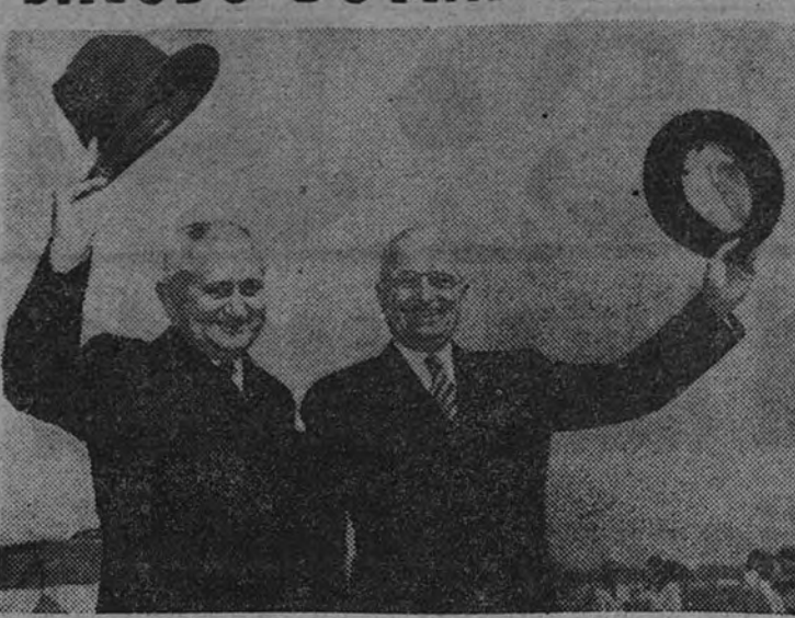
El Presidente del Brasil, general Dutra, con su colega norteamericano, Henry Truman, corresponden a los saludos de la multitud que acudió a saludarlos con motivo de la visita que el jefe de Estado brasileño acaba de realizar a los Estados Unidos.