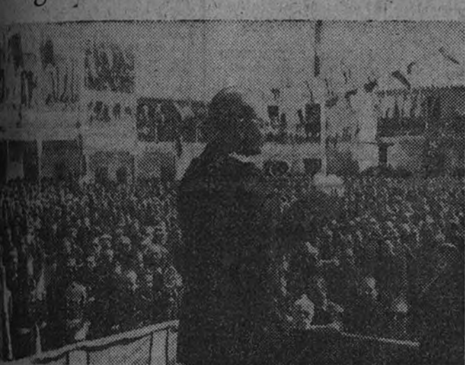
El Gobernador Civil y Jefe Provincial, camarada Carlos Ruiz, dirige la palabra a la población durante los actos celebrados en Pinto

El Gobernador Civil y Jefe Provincial presidió el acto y la concentración falangista efectuada con tal motivo