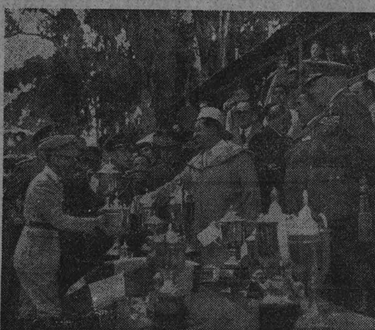
Su Alteza Imperial el Jefe repartiendo los premios del concurso hipico celebrado en Tetuan con motivo de las fiestas que se celebran estos días en la capital del Protectorado español en Marruecos con ocasión de la boda del Jefe.