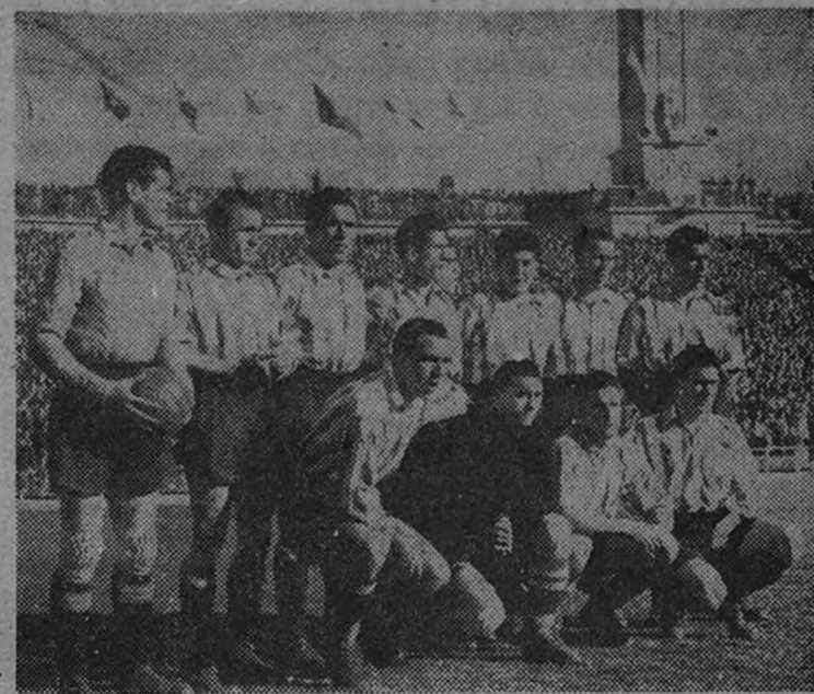
El Atlético de Bilbao, equipo copero por excelencia, que una vez más llega a la final, teniendo en esta ocasión al Valencia como adversario

En las eliminatorias, bilbaínos y valencianos demostraron su gran forma actual