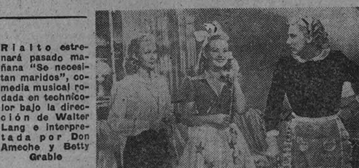
Rialto estrenará pasado mañana "Se necesitan maridos", comedia musical rodada en technicolor bajo la dirección de Walter Lang e interpretada por Don Ameche y Betty Grable