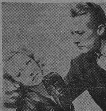
Laraine Day y Gene Raymond, personajes centrales de "La huella de un recuerdo", próximo éxito de la distribuidora C. B. Films

"La huella de un recuerdo", producción R. K. O. Radio Pictures, constituirá un éxito sin precedentes, con motivo de su próximo estreno, distribuido por C. B. Films, S. A.