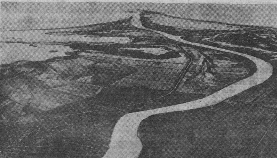
El delta del Ebro