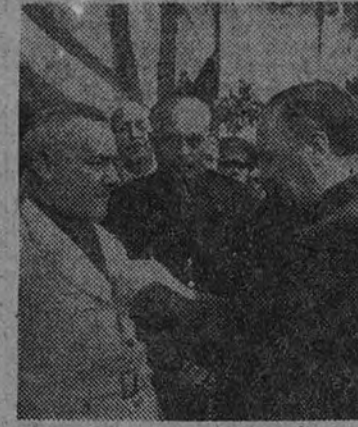
El Secretario General impone al Jefe Comarcal la Cruz de la Orden de Cisneros

Cuando el Ministro abandonaba el Ayuntamiento, la Vieja Guardia, que se hallaba formada a la salida, hizo