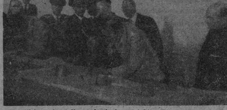
Visita a los talleres donde los reclusos liberan su pena