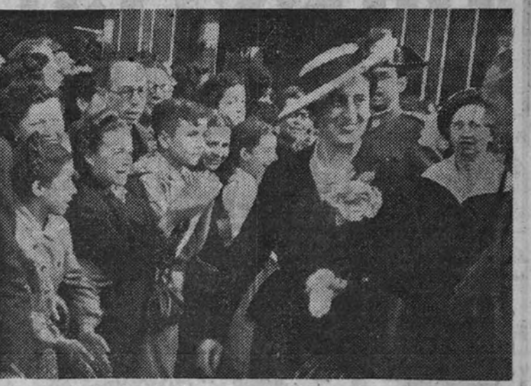
La esposa de Su Excelencia el Jefe del Estado, doña Carmen Polo de Franco, es objeto de manifestaciones de simpatía por parte del público barcelonés en sus distintas visitas a los establecimientos de la capital (Foto Cifra.)

do que Barcelona desea paz y alegría para su ejemplar Caudillo y nuestra queridísima España. (Cifra.)