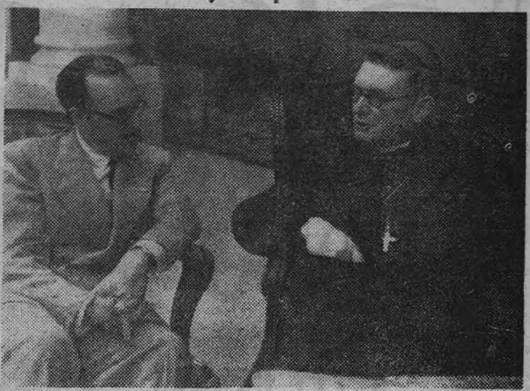
El Delegado Nacional de Sindicatos durante su entrevista con el obispo de Menevia (Gales), monseñor Petit

Como representante de la Iglesia, asegura que el concurso tiene para él matices muy simpáticos