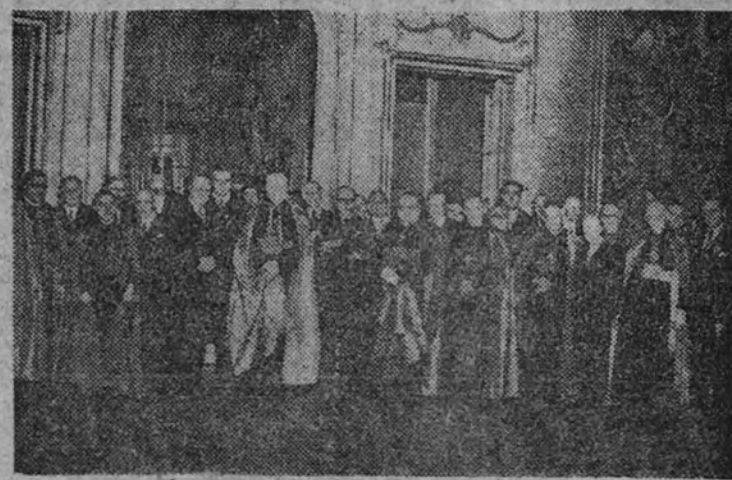
Personalidades asistentes a la recepción celebrada en el Ministerio de Asuntos Exteriores.

Ayer por la mañana el cardenal Tedeschini visitó los locales del Consejo Superior de los Jóvenes de Acción Católica, donde celebró una misa. En el fondo, todo se repite machaconamente desde hace más de quince días. Dos nuevos elementos tan sólo surgieron en estos últimos