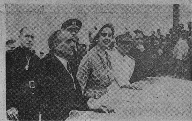
El Jefe del Estado, acompañado de su esposa, autoridades de Barcelona y Alcalde de Sitges, contempla el paseo del Mar desde la Mirada del Balcón.