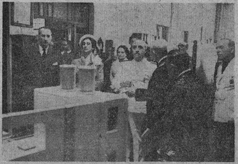
El Caudillo, acompañado de su esposa, Ministros de Agricultura y autoridades barcelonesas, visita la estación vinícola de Vilanova del Panadés.