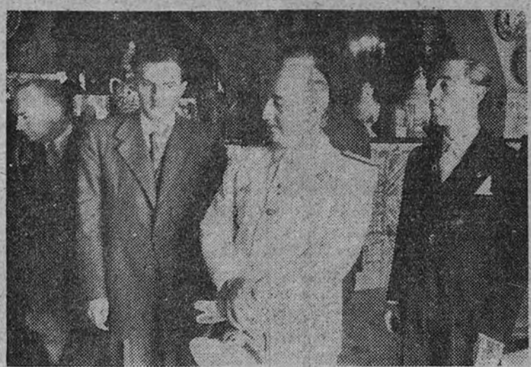
Franco, durante su estancia en Sitges, visitó el Museo "Cau Ferrat" de aquella localidad.