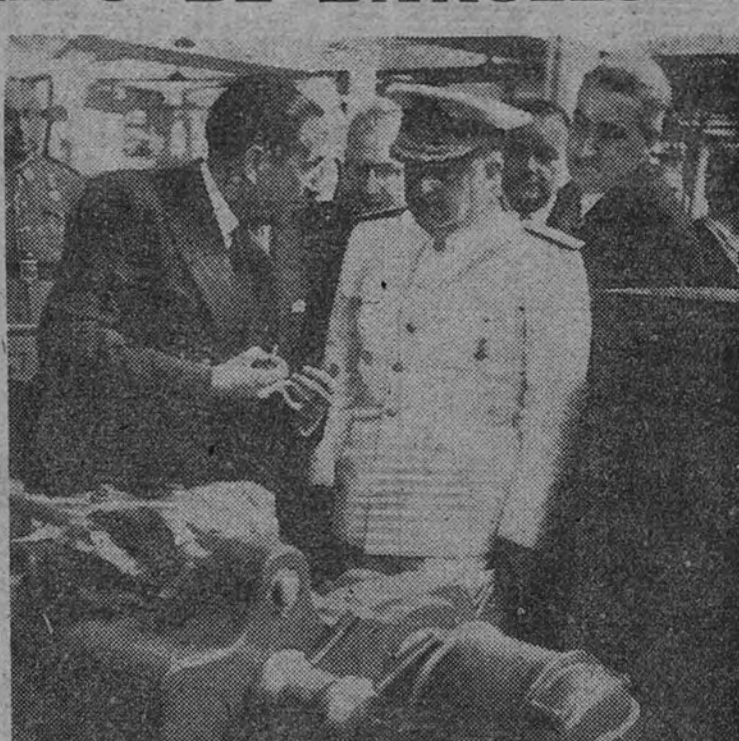
El Jefe del Estado, acompañado de los Ministros de Industria y Comercio, Gobernación y otras personalidades, visita la Empresa Nacional de Autocamiones instalada en La Sagrada

En el escenario, adornado con tapices y banderas, se situaron el Caudillo y su esposa.