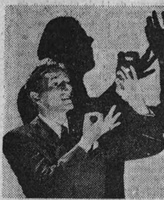
El gran actor cómico Danny Kaye, protagonista del technicolor Radio "La vida secreta de Walter Mitty", que en unión de "La mujer del cuadro" se exhibirá mañana en el Real Cinema.

Interpretan el film la bellísima actriz Hedy Lamarr y el coloso del teatro de imágenes Spencer Tracy, en la plenitud de su arte.