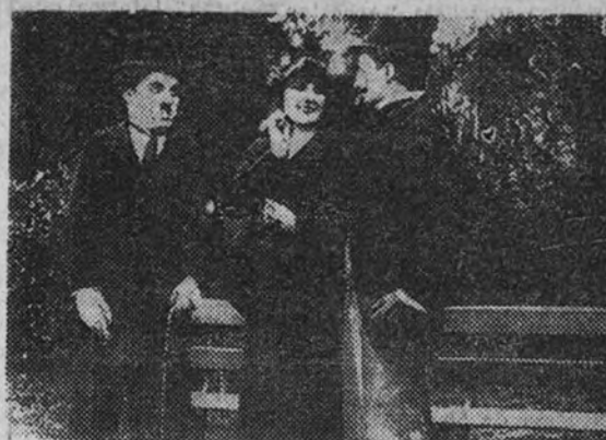
En el cine Imperial continúa el éxito del gracioso programa "¡Ay, qué tios!", formado por las más divertidas creaciones de los ases cómicos Charlot, Max Linder, Jaimito y Harold Lloyd. He aquí un fotograma de uno de estos regocijantes films.

GOYA - BARCELO - GONG MANANA LUNES, PRIMER REESTRENO SPENCER TRACY HEDY LAMARR LA VIDA ES ASI UN HUMORISMO NUEVO Y REGOCIJANTE EN LA MAS ORIGINAL PELICULA METRO GOLDWYN MAYER