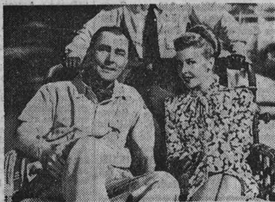
"La huella de un recuerdo", que interpretan Laraine Day, Brian Aherne y Gene Raymond, y que C. B. Films exhibe en el Avenida, entra en su tercera semana de éxito.

PALACIO DEL CINE Y PROYECCIONES MARANA LUNES, PRIMER REESTRENO DE LA MAGNIFICA SUPERPRODUCCION MAR DE HIERBA con MELVYN DOUGLAS, KATHARINE HEPBURN y SPENCER TRACY