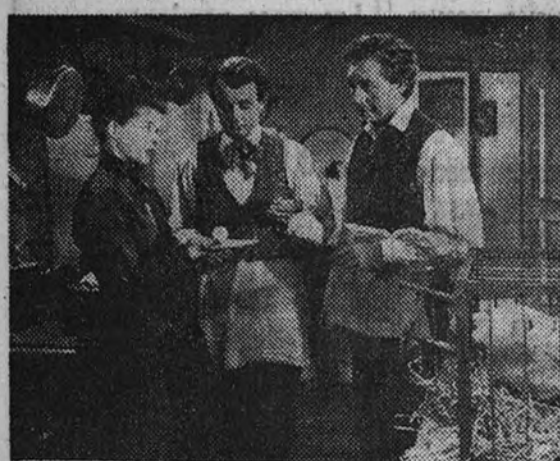
Mañana, Metro-Goldwyn-Mayer presentará en el Callao la superproducción "Pasión inmortal", con Paul Henreid y Katharine Hepburn como protagonistas.