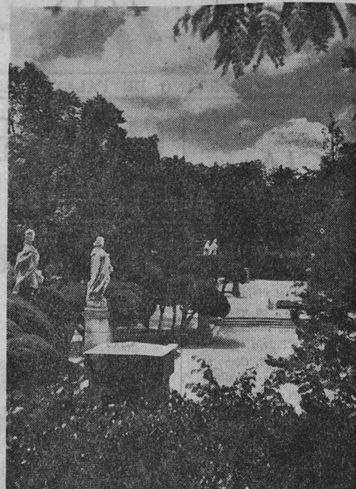
En la blanca ignición cuando vengán los días agostosos.

Son un triunfo y un optimismo para el madrileño, que tímidamente se ha lanzado a la calentura del buen día de junio y espera verlos más sollamados y