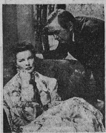
Palacio del Cine y Proyecciones anuncian para mañana, lunes, el reestreno de "Mar de hierba", creación de Katharine Hepburn.

PALACIO DEL CINE Y PROYECCIONES MARANA LUNES, PRIMER REESTRENO DE LA MAGNIFICA SUPERPRODUCCION MAR DE HIERBA con MELVYN DOUGLAS, KATHARINE HEPBURN y SPENCER TRACY