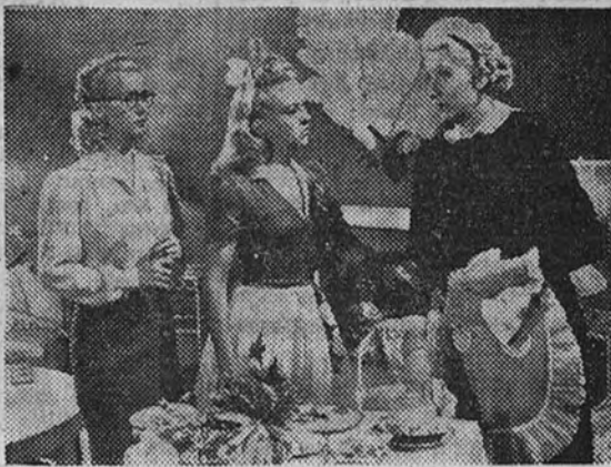
Tres semanas de éxito en la sala del Rialto prueban el triunfo de la comedia en technicolor "Se necesitan maridos", de la que reproducimos este fotograma.

NUEVA TEMPORADA DE VERANO EN EL REAL CINEMA