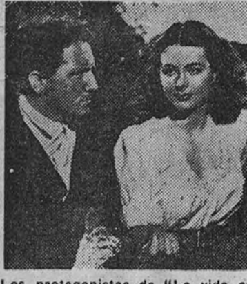
Los protagonistas de "La vida es así", Spencer Tracy y Hedy Lamarr, en una escena de este film, que, en primer reestreno, se exhibirá desde mañana en Barceló, Goya y Gong.