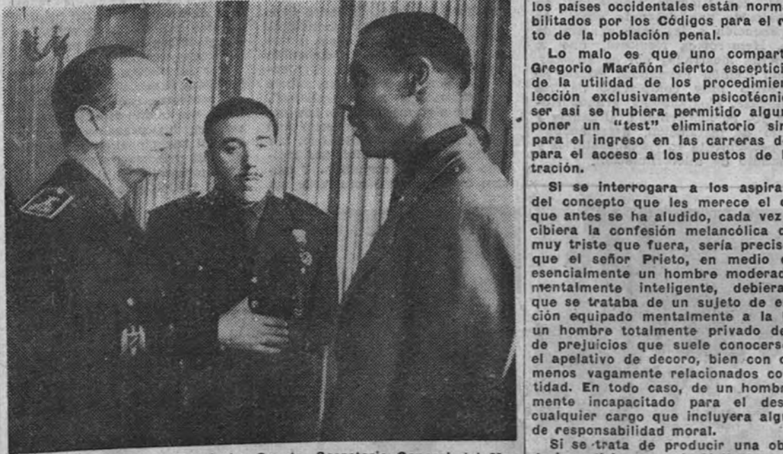
El camarada Raimundo Fernández-Cuesta, Secretario General del Movimiento, durante su estancia en Barcelona visitó los distintos servicios de Falange. Nuestra información gráfica recoge el momento en que el camarada Fernández-Cuesta cambia impresiones con los Jefes de Distrito en la Jefatura Provincial de Falange.