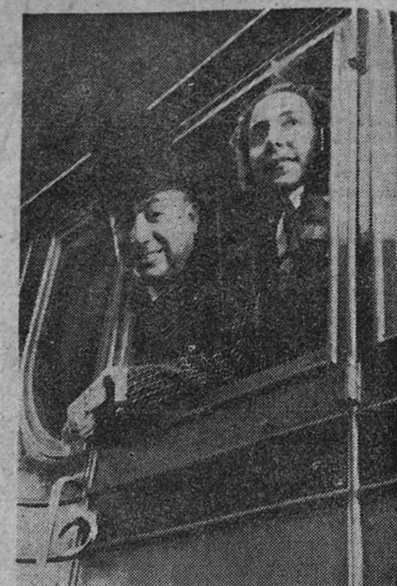
El día de la posibilidad de su propio tren de la fresa. Un Aranjuez donde puedan reposar de todo el atrezo municipal de la semana.