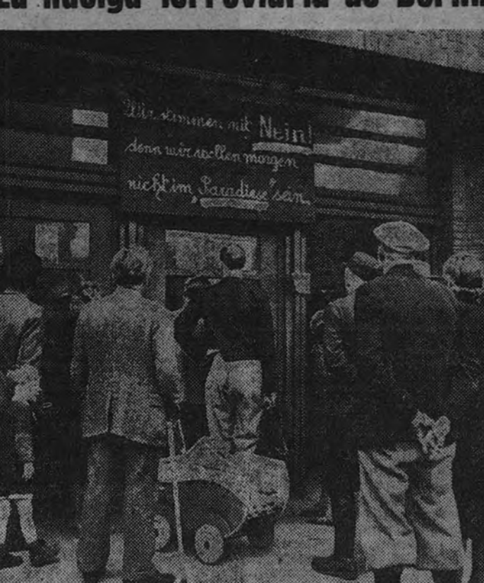
Continúa en Berlín la huelga ferroviaria. Invitados a reanudar el trabajo, los obreros han organizado una votación para decidir si aceptan o no. La propaganda se expresa en carteles como el de la fotografía, en el que se lee: "No queremos estar mañana en el Paraíso. Se reñen, naturalmente, al desacreditado paraíso soviético."