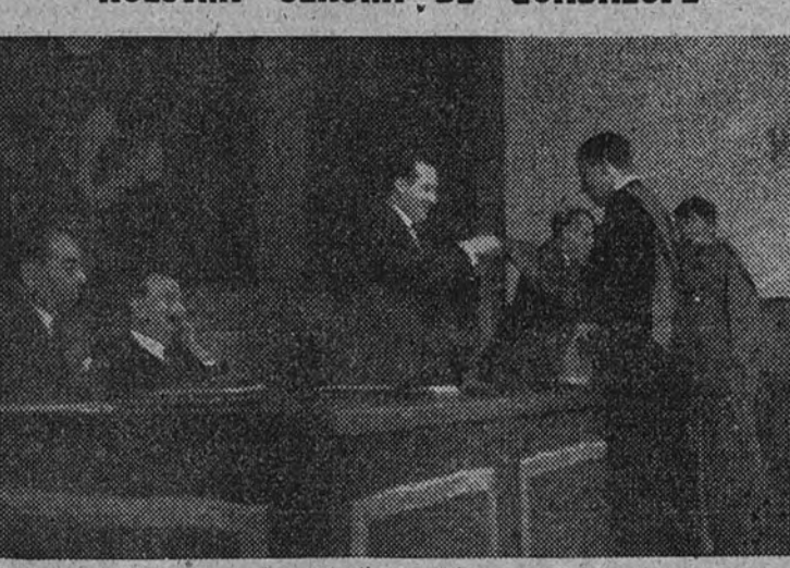
Entrega de las becas a los estudiantes hispanoamericanos que han seguido el curso en el Colegio Mayor "Nuestra Señora de Guadalupe".