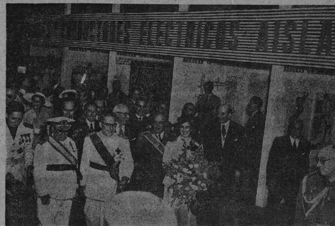
La inauguración de la Feria de Muestras de Barcelona.

que Su Excelencia el Jefe del Estado ha señalado, tantas veces como indispensables para el auge y el progreso de la agricultura española: los abonos, que al enriquecer nuestras tierras elevan sus rendimientos. Y sabido es que Chile, como nos recuerda su pabellón en la Feria de Muestras de Barcelona, es en el mundo el único país poseedor de yacimientos de "caliche", ese compuesto mineral del cual se extrae el fertilizante nitrato.