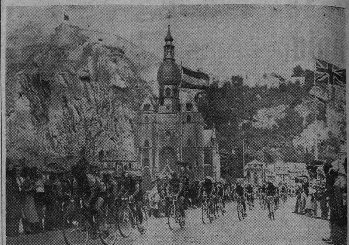
Los corredores participantes en la Vuelta a Francia atraviesan por Namur, la ciudad belga que figuraba en el recorrido de la segunda etapa, Reims-Bruselas

Kubler venció en la etapa de ayer y Marinelli va el primero en la clasificación general