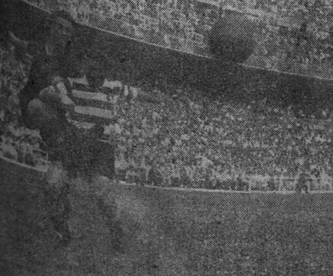
Cuando los del Spórting contestaban en el marcador, el partido quedaba más incierto que al principio, porque hasta allí los del Barcelona