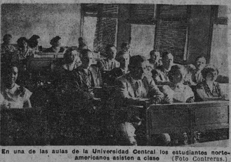
En una de las aulas de la Universidad Central los estudiantes norteamericanos asisten a clase.

Asisten al curso inaugurado en la Universidad Central