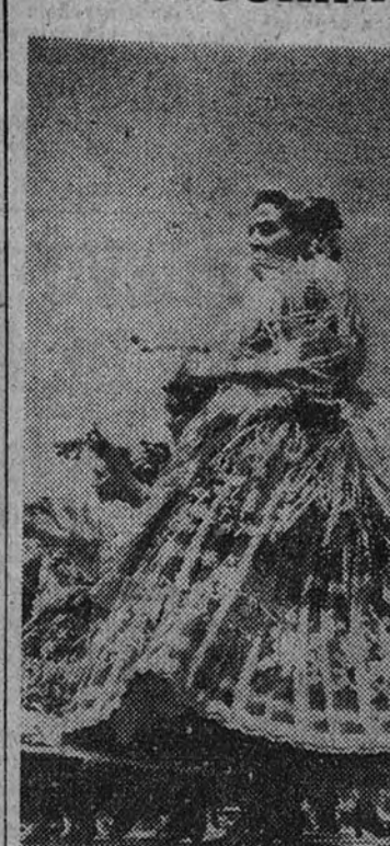
El Caudillo recibe a la Comisión de la Unión Nacional de Cooperativas del Campo

Durante las fiestas de verano que actualmente se celebran en Lausana, especialmente invitadas, cuatro grupos de danzas de la Sección Femenina de La Coruña, Barcelona, Cádiz y Yecla. Nuestra información gráfica recoge un momento de la actuación del grupo de Yecla.