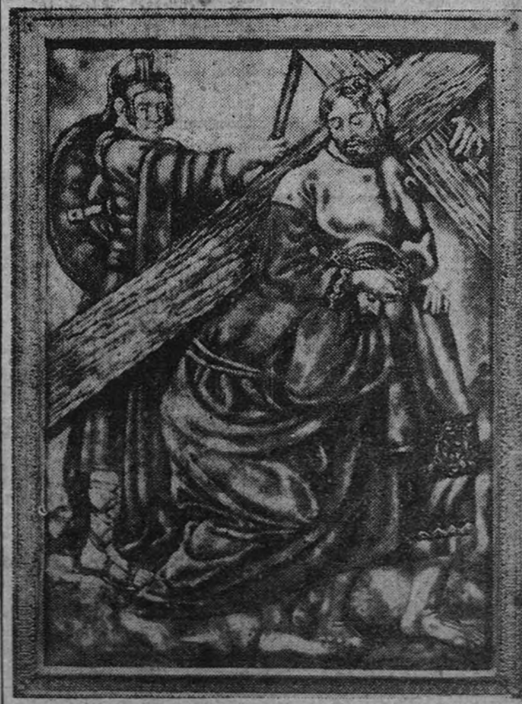
La Vieja Guardia, por suscripción realizada en toda España, ofrece a la Casa-Prisión "José Antonio" un magnífico Vía Crucis realizado en esmalte sobre cobre por el artista bilbaíno Aurelio Lombra. Reproducidos uno de los cuadros del artístico Vía Crucis.

PARIS.—Los rusos han manifestado que no acudirán a las competiciones internacionales cinematográficas que próximamente se celebrarán en Cannes y Venecia. No les agrada, dicen, el reglamento de las mismas. (Efe.)