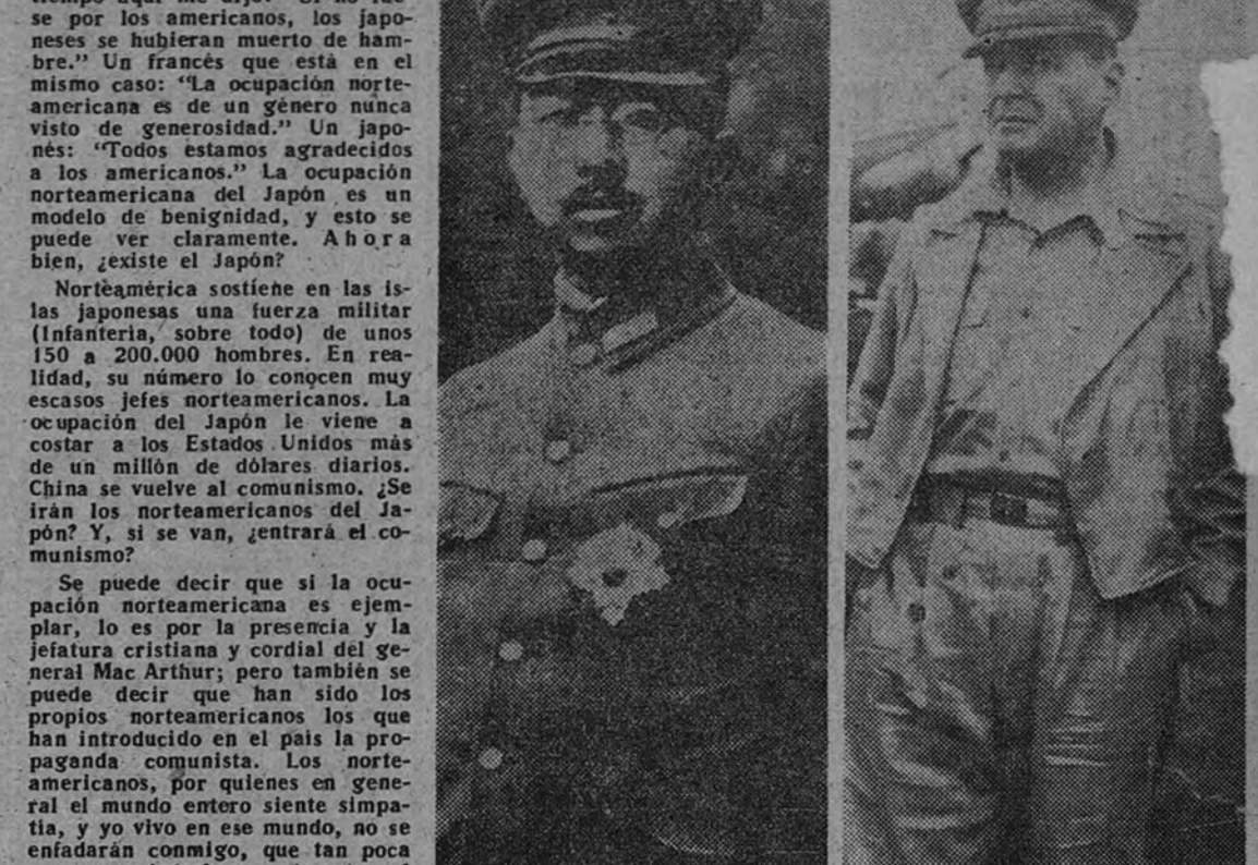
Hiro-Hito Mac Arthur