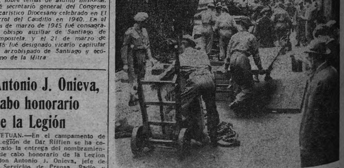
Ante la prolongada actitud de rebeldía de los trabajadores del puerto de Londres las fuerzas del Ejército han tenido que hacerse cargo de la carga y descarga de los buques. En la foto vemos a unos soldados descargando carne procedente de la Argentina.