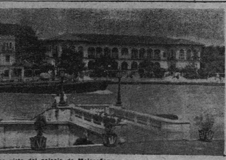
Una vista del palacio de Malacañang