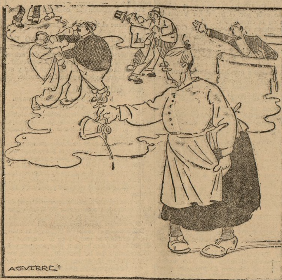
La balsa de aceite