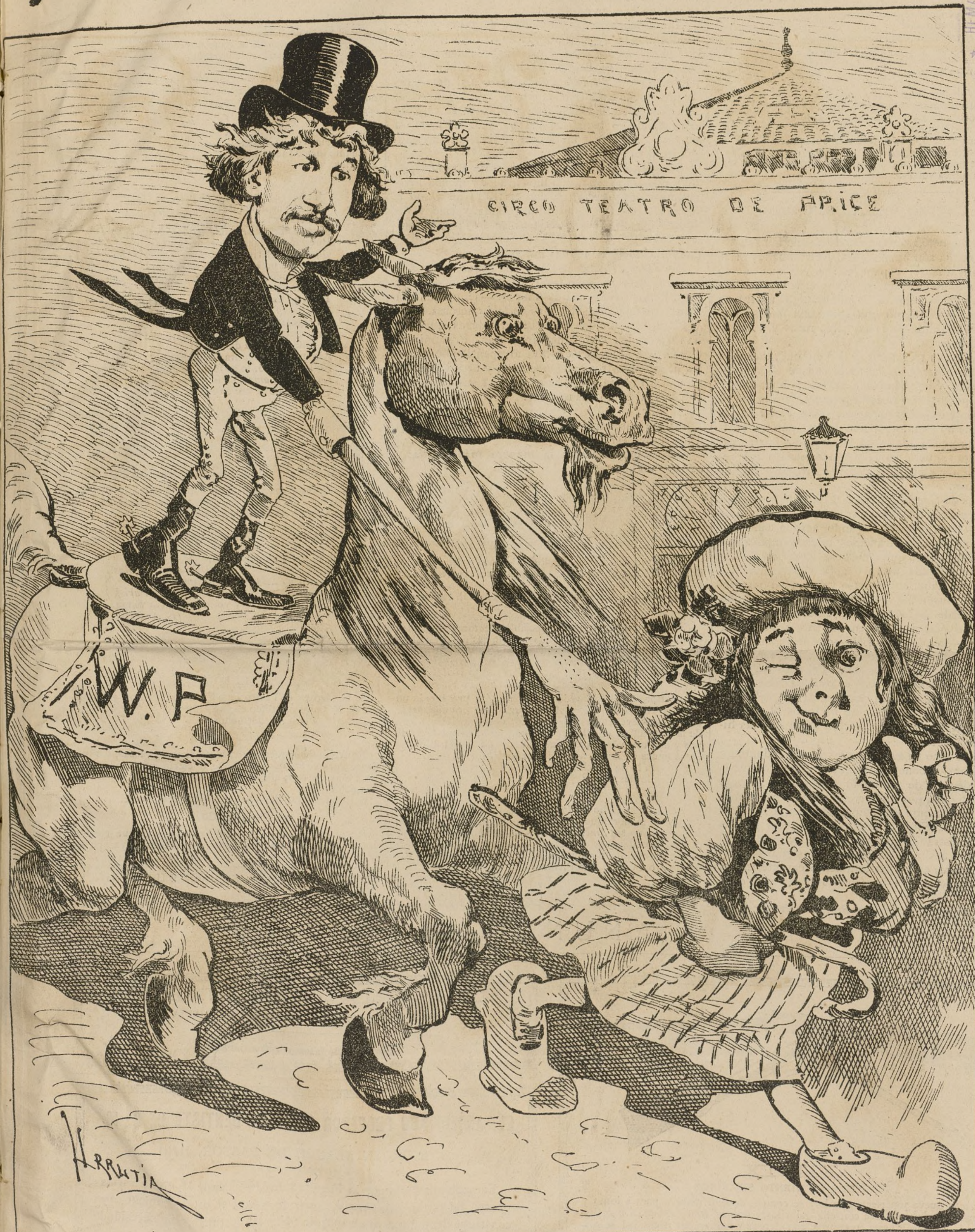
POR UN POCO.