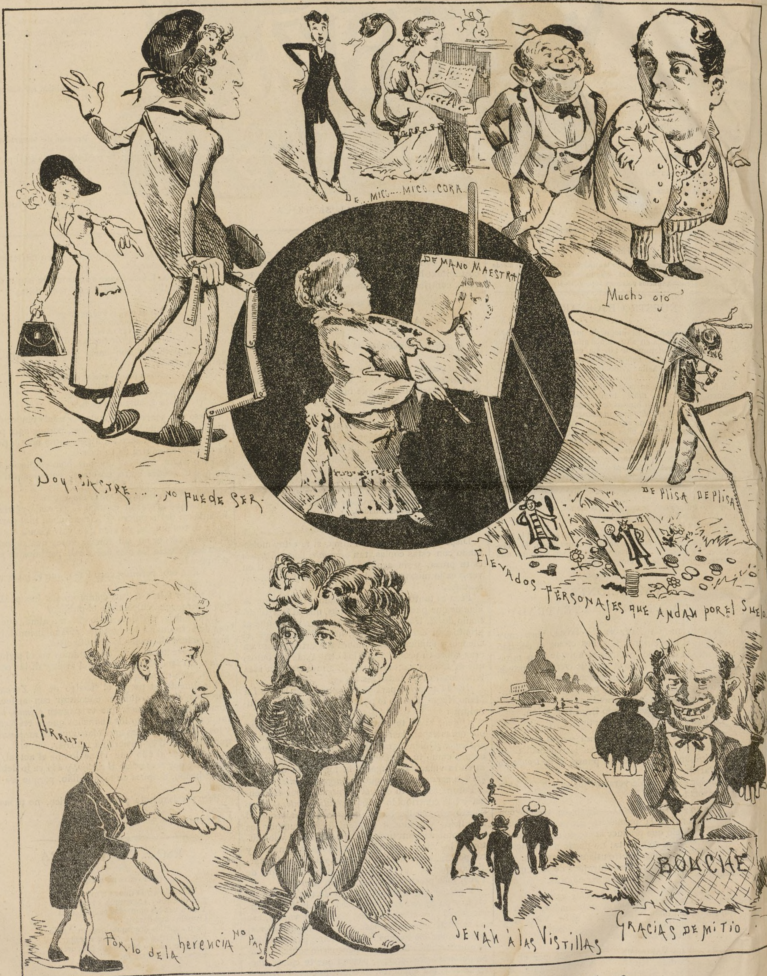
JUEGO DE PRENDAS.