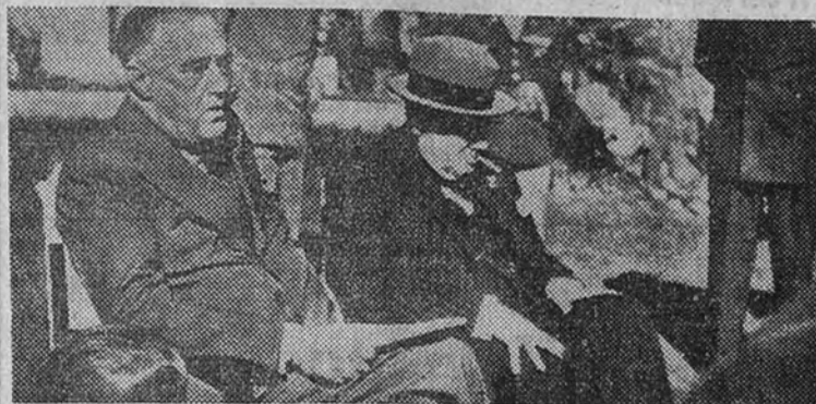
Enero de 1943. Casablanca. Mr. Churchill, junto con el Presidente Roosevelt, recibió a los representantes de la Prensa, durante la conferencia de la fórmula de "rendición incondicional".

dicción incondicional se dejase a un lado hasta ulterior examen y que se aclarara que se trataba de "rendición inmediata".