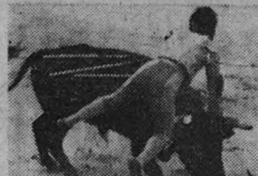
Barajas en una de las cogidas que sufrió