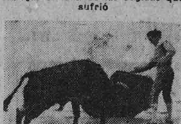
Bamala en un derecho al quinto novillo