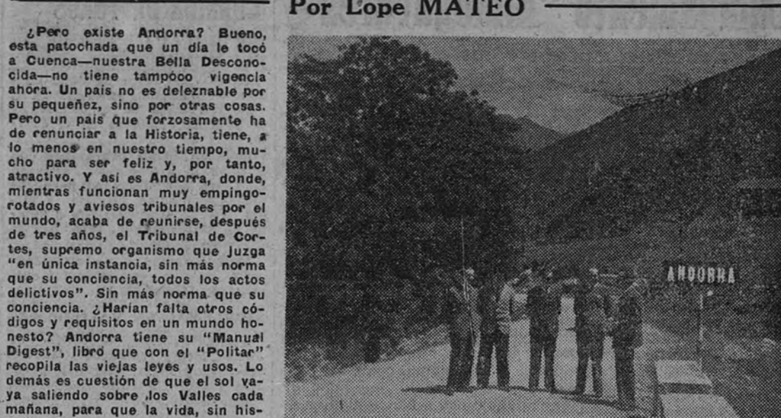
El autor del artículo, en la entrada de Andorra