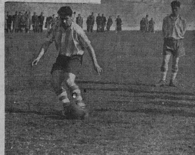
Los jugadores del Atlético Madrileño, también por el Atlético Madrileño.

Para esta misma fecha son esperados el sueco Carlsson y el danés Mathiensen