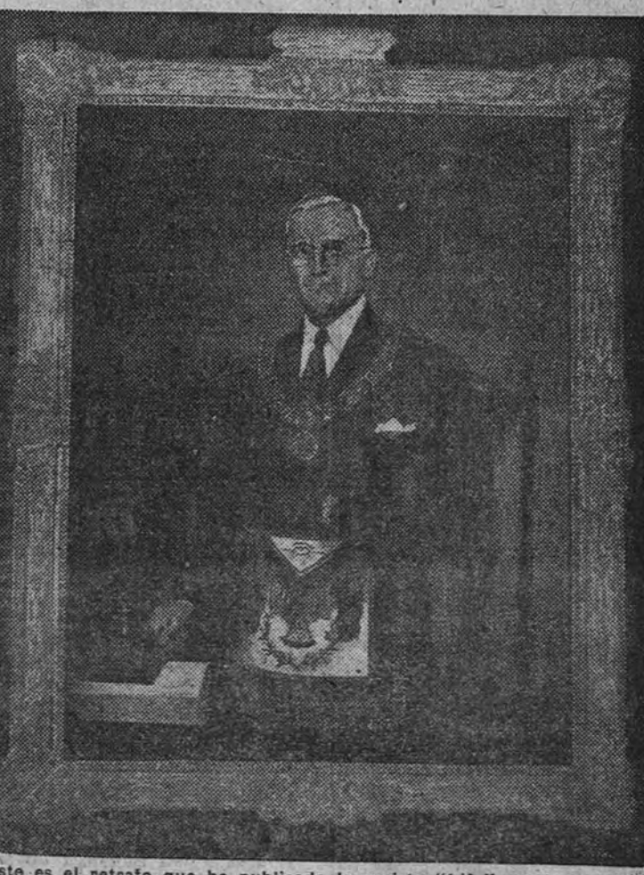
Este es el retrato que ha publicado la revista "Life", y al que alude nuestro colaborador J. Boor en el artículo "Masonería", que publicamos en esta misma página.