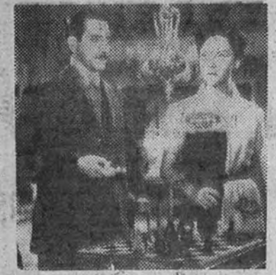
Francisco Petrone y Amelia Bence, protagonistas del film "Todo un hombre", que, presentada por Suevia Films, se estrena mañana, lunes, en los cines Goya y Barcelo