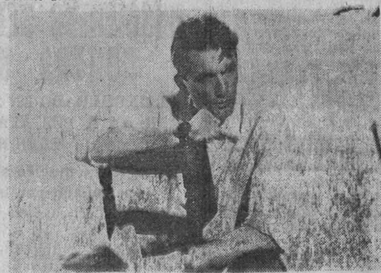
Gregory Peck, el famoso galán de la pantalla, principal protagonista de la nueva superproducción "La barrera invisible", que, presentada por la 20th Century Fox, se estrena mañana, lunes, en el cine Palacio de la Prensa

Y ese título corresponde al tema de don Miguel de Unamuno conocido en novela por "Nada menos que todo un hombre", maravilloso estudio de un carácter varonil, que ahora interpretan Francisco Petrone y Amelia Bence, bajo la experta dirección del realizador francés Pierre Chenal. El estreno ha despertado una expectación justificada entre los aficionados al séptimo arte.