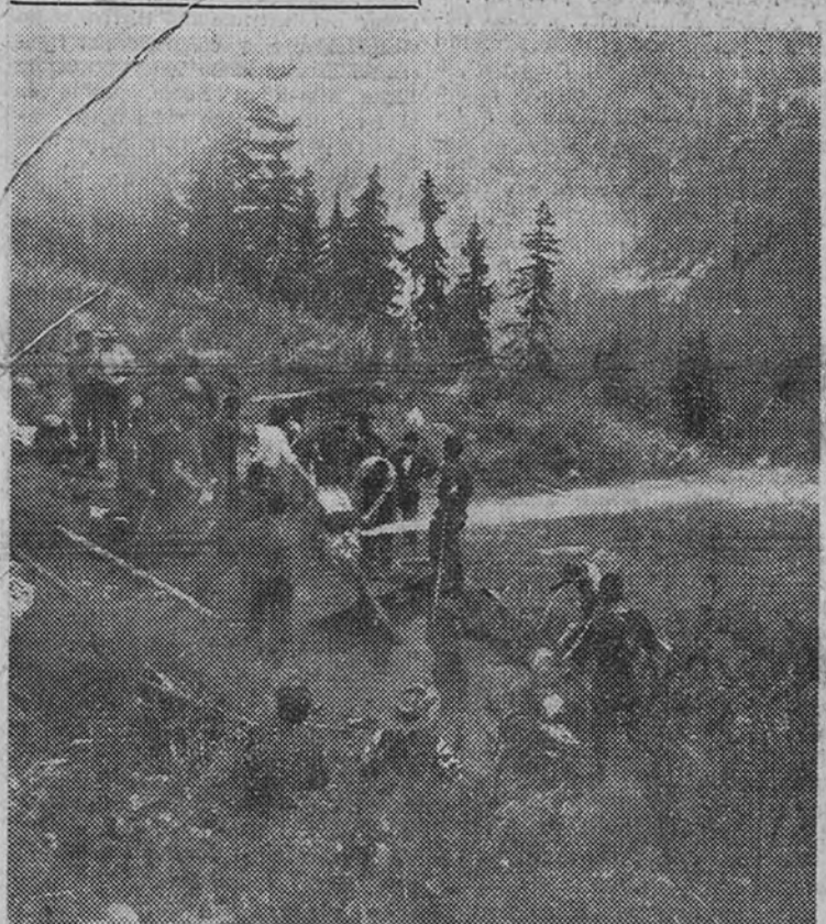
Bomberos y paisanos voluntarios instalan una bomba contra el fuego cerca de una fuente. En tres días los bosques de Rechy han quedado destruidos. La región de Sierre ha experimentado graves pérdidas.

Después de estos actos, doña Carmen Polo de Franco abandonó la ciudad, trasladándose a Alfoz, donde se le tributó un recibimiento muy efusivo. Durante la breve estancia de la ilustre dama en Alfoz, visitó la tumba de la madre del Fundador de la Falange, José Antonio Primo de Rivera, sobre la que depositó un ramo de flores, después de rezar una oración, y acto seguido regresó a San Sebastián. (Mentelita.)