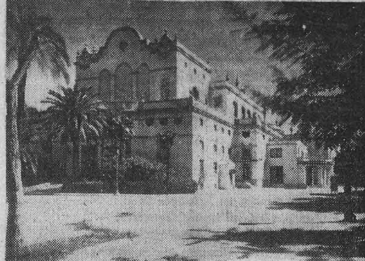
El Gran Casino Municipal de Sevilla, sede de la Exposición de Avicultura

Bajo el alto patrocinio del Jefe del Estado, y con el apoyo económico de varios Ministerios, se va a celebrar en Sevilla, en el próximo otoño, la V Asamblea Nacional de Avicultura. La importancia de esta reunión, en lo que al mejoramiento de las granjas españolas se refiere, salta a simple vista, y más aún teniendo en cuenta que la aportación extranjera va a ser muy importante, lo que permitirá adoptar aquellos sistemas de alimentación, higiene, etc., que se consideren convenientes. La Comisión organizadora, que actualmente estudia la máxima actividad para que el certamen responda a la importancia del objetivo a lograr, ha conseguido de las Jefaturas Provinciales Sindicales de Ganadería relación nominal de cuantas personas están relacionadas con la avicultura, con lo que se ha conseguido formar un interesante fichero, incompleto aun por no haberse recibido las relaciones referentes a algunas provincias. Cuando el citado fichero esté completo, constituirá un dato valiosísimo, por permitir en cualquier momento conocer la importancia de la avicultura en cualquier provincia española.