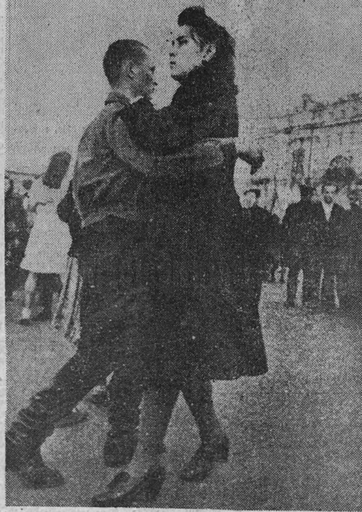
Los soviets, que lo han inventado todo, desde la cafetera exprés hasta el existencialismo, pasando por el colchón sin muelles, no han inventado aún, que sepamos, el "boogie-woogie". Como pueden apreciar los entendidos y apreciar dolorosamente los propios soviets, lo que priva en Rusia es el foxtrot. Es un país en el cual, por lo general, se inventan las cosas tarde: se inventan cuando ya la experiencia ajena las ha situado previamente como inventos. Los comunistas puros se quejan de que la Juventud comunista, presa de "un cosmopolitismo bastardo, parte principal del programa angloamericano de dominación mundial", se acocia al sinuoso desde el Gobierno hacia los fundamentos filosóficos de la doctrina del partido. Esta pareja—que vale lo menos tres—danza dramáticamente una musiquilla burguesa. Probablemente, entre las grandes botas de él y las no menos grandes botas de ella, la verdadera civilización se siente pisoteada en su más recóndito hígado. Estos tios, si siguen así, van a conseguir hacer de un alegre foxtrot, arrastradillo y tal, un tango lírico y delirante. Ya era hora de que el foxtrot sentase la cabeza, se cubriera de luto y tuviera mal de piedra.