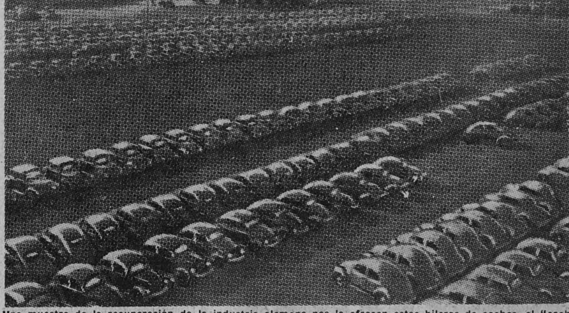
Una muestra de la recuperación de la industria alemana nos la ofrecen estas hileras de coches, el "coche popular", en uno de los patios de una importante fábrica en la zona británica de ocupación.

Constante aumento de habitantes en la trizona