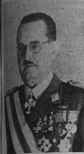
General Don Francisco Rosalendi, nuevo Gobernador del África Occidental Española.

El general don Francisco Rosalendi, nuevo Gobernador del África Occidental Española, nació en 1888 en la localidad de Alcañices (Zamora). Fue promovido a general en 1930. Ha sido gobernador de las provincias de Orense, Lugo y Pontevedra. En 1939 fue promovido a general. Ha sido gobernador de las provincias de Orense, Lugo y Pontevedra. En 1939 fue promovido a general. Ha sido gobernador de las provincias de Orense, Lugo y Pontevedra.