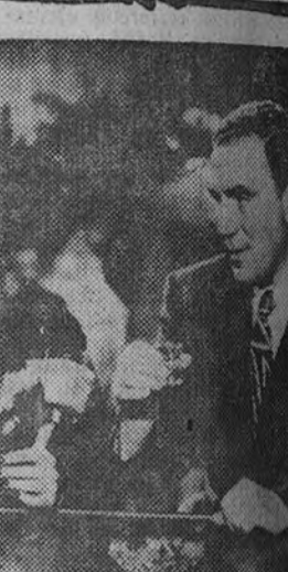
El Callao anuncia para mañana lunes el estreno de "La dalia azul", e u perproducción Paramount distribuida por Mercurio Films, S. A., de la que reproducimos esta escena

Los impresionantes fotogramas de esta película suspenden el ánimo de los espectadores, pues no se trata de una producción de terror como otra cualquiera, sino de algo profundamente nuevo dentro de este difícil género. "Fantomas contra fantomas" llenará los suntuosos locales Progreso y Luchana desde mañana lunes.