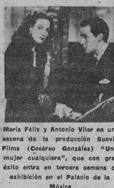
Maria Félix y Antonio Vilar en una escena de la producción Suevia Films (Cesáreo González) "Una mujer cualquiera", que con gran éxito entra en tercera semana de exhibición en el Palacio de la Música

Verónica Lake, sugestiva, resuelta y amorosa, colabora con Alan Ladd para el mayor éxito interpretativo de esta superproducción Paramount, distribuida por Mercurio Films, S. A., que mañana lunes será estrenada en el lujoso cine Callao.