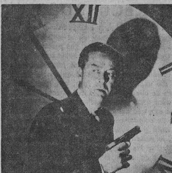
Ray Milland en un impresionante primer plano de la superproducción Paramount "El reloj asesino", que distribuida por Mercurio Films, S. A., triunfa en segunda semana en la pantalla del cine Avenida