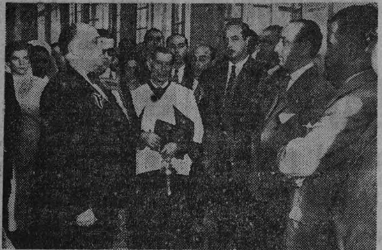
El marqués de la Valdivia pronuncia unas palabras en el acto celebrado en memoria de Manolete en el Hospital Provincial.

Se celebraron misas en el Hospital Provincial y San Ginés, y una velada literaria organizada por el Club Taurino