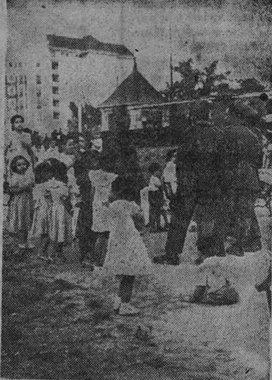
Los niños, sino por las niñas y los soldados, por el agua de cebada del quísico, por el difícil papel del trombón de la banda, por la vejicela de las pelotas de papel y los altramuzos, por la cuenta del camarero, a quien ya no le caben más gaseosas en la cabeza, y hasta por aquel perro vulgarísimo, vagabundo y medio cojo que lame hasta la extenuación y la hidrofobia las arrugadas bolitas de patatas fritas. Y velan también por la tarde, por la gloriosa tarde del verano madrileño, reventando de amor por los cuatro costados; por la tarde turgente y grávida, plena de luz, de paz, de cotidianidad sobre el paisaje de la guerra reciente, sobre el alto estirio de la Villa, sobre el humo caminante de los trenes que parten y que llegan.—R.

Suenan en el pasillo los murmullos de los más destacados actores españoles, que han sido llamados para seleccionar los que han de compartir el reparto de "Jack, el negro" con George Sanders y Herbert Marshall, que llegarán a Mallorca a primeros