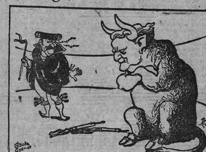
—Entonces, ¿es de veras que no quieres jugar conmigo? (De “L'Aurora”).

Otros comunistas que aparentemente apoyan el régimen de Tito, añade el periodista, obedecen. (Continúa en cuarta página.)