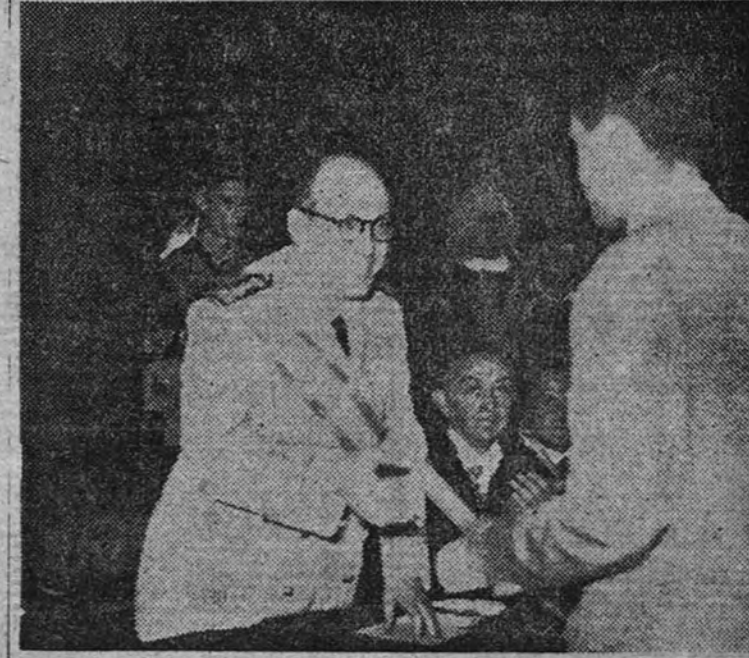
El Ministro de Educación Nacional entregando en el acto de clausura de los cursos de la Universidad Internacional de Santander los correspondientes diplomas a los alumnos que asistieron a ellos.