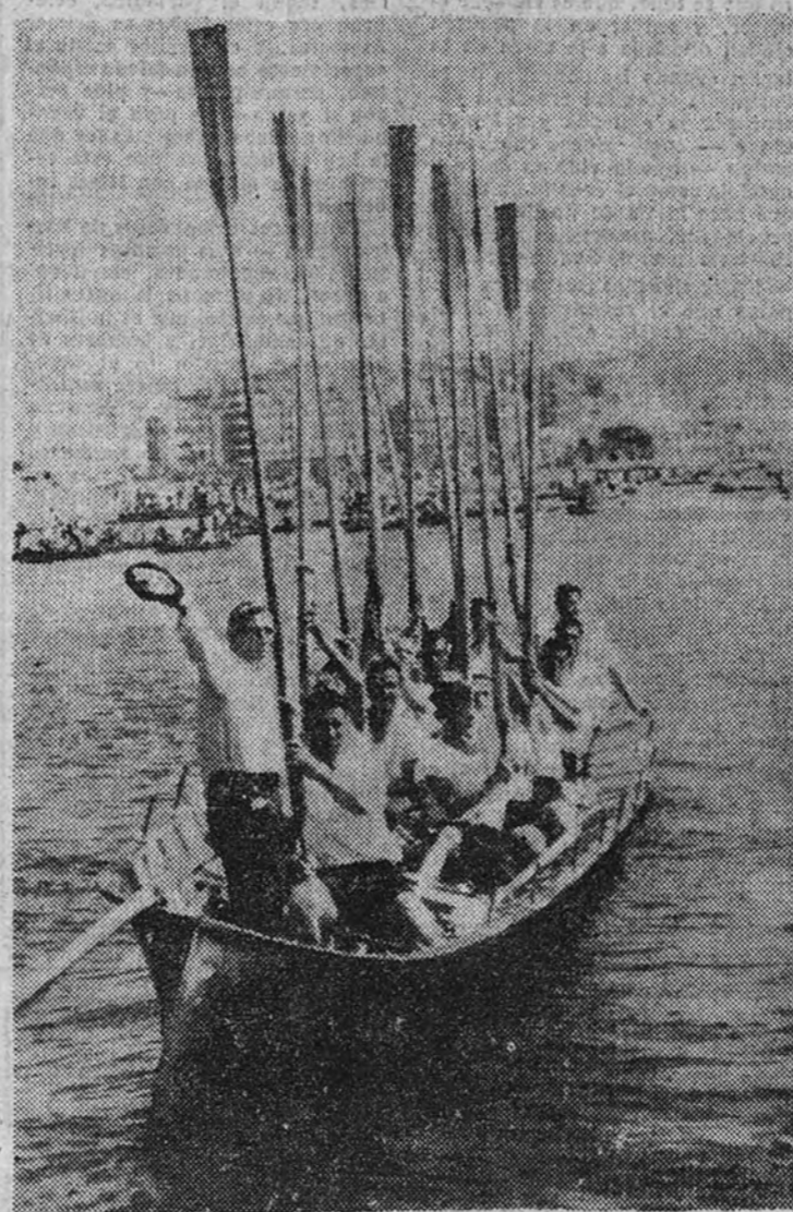
La trainera de Pedreña, que el domingo venció en la regata de San Sebastián con tan notable ventaja, que virtualmente puede dársele como ganadora de la bandera de honor.

La ventaja adquirida la sitúa como virtual ganadora de la bandera