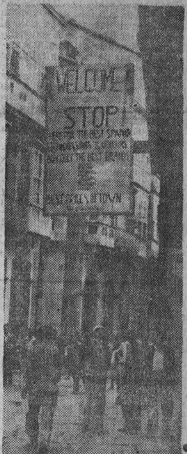
Los establecimientos de El Ferrol del Caudillo han expresado con profusión de carteles su bienvenida a los marinos norteamericanos. He aquí uno de estos "Welcome" a la puerta de una tienda ferroviaria.