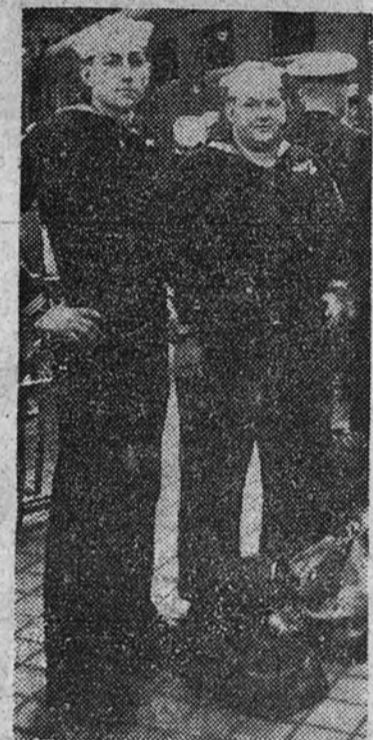
Grupos de marineros al descender del tren en la estación del Norte.