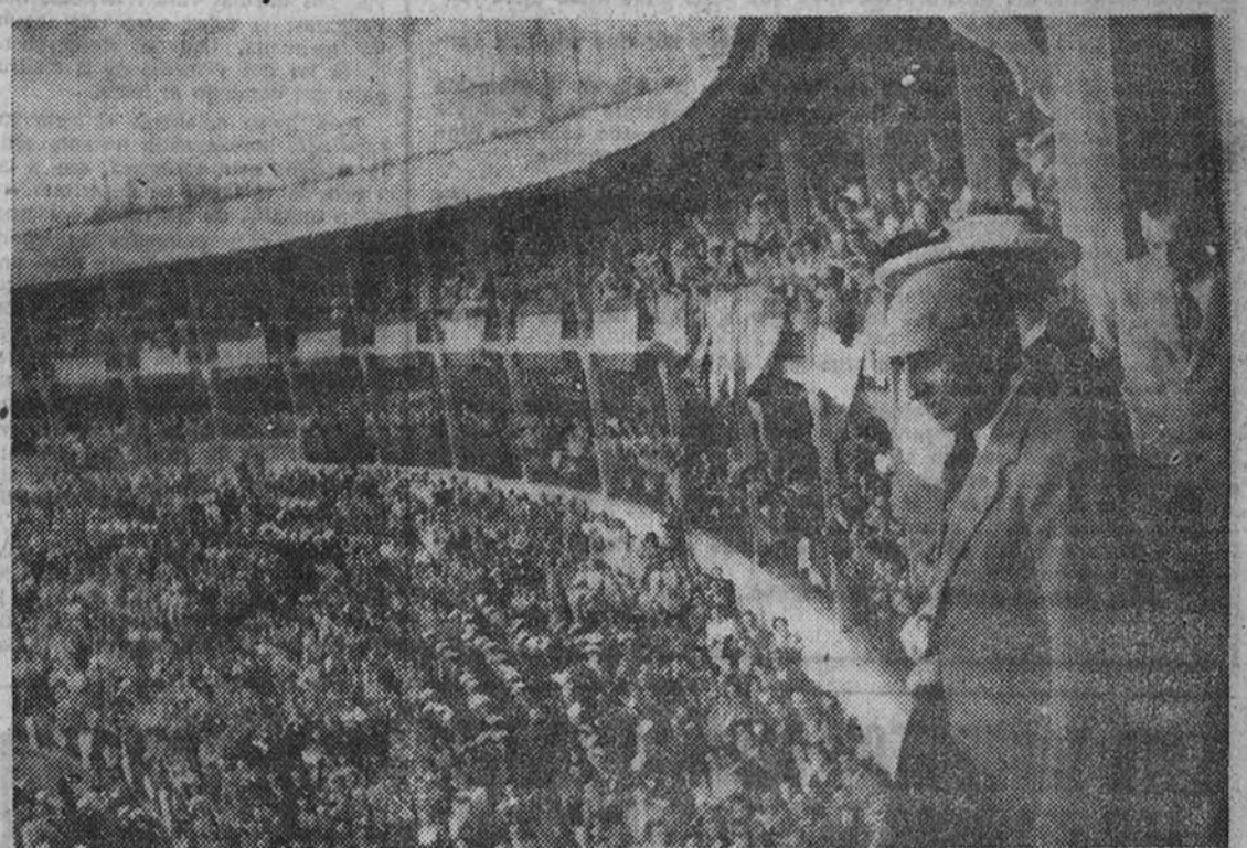
Repetidas veces ha ofrecido el pueblo coruñés su fervoroso homenaje al Jefe del Estado. En esta gráfica recoge el momento en que el Caudillo llega a la plaza de toros de La Coruña, donde es acogido con cariño y entusiasmo.